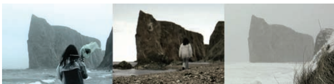
Fluo et Le rocher d'Étienne de Massy

expérimental québécois qui s'est suicidé à l'âge de 49 ans. Le prolifique Ushev livre ici son film le plus ambitieux et aussi le plus achevé, ce qu'ont reconnu les jurys de divers festivals qui l'ont déjà primé à six reprises. Somptueux et foisonnant tant sur le plan visuel que sur le plan sonore, le film suscite l'admiration même si la liberté prise par rapport aux éléments biographiques paraît discutable : Les journaux de Lipsett mêle sans aucune distinction des éléments de la vie du cinéaste à d'autres puisés dans l'histoire familiale du scénariste, l'écrivain (et directeur artistique du Festival d'Ottawa) Chris Robinson. En fait, la réussite du film réside dans la capacité d'Ushev et de son scénariste de donner une forme cinématographique à la spirale de la dépression, leur capacité d'atteindre, si ce n'est la vérité biographique, du moins la vérité de la maladie, de la souffrance.