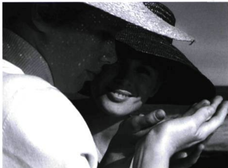
Persona d'Ingmar Bergman

Trois films des années 1950 utiliseront beaucoup plus explicitement la mer comme cadre, aussi bien que comme lieu symbolique : Jeux d'été (1950), porté par l'interprétation troublante de Maj-Britt Nilsson, présente la nature comme idéal nostalgique (la mer, immense utérus) où la liberté des corps et la force du désir se découvrent et s'affirment; dans L'attente des femmes (1952), la nature ouvre le film (eau, forêt, chalet, bain) et, ultimement, symbole d'harmonie, permet les réconciliations les plus improbables – le symbolisme convenu (eau=sexe) est par contre assez plat et n'ajoute rien au récit, non plus qu'à l'art du cinéaste; enfin, l'extraordinaire Monika (1952) reprend tous ces thèmes et les porte à un degré d'incantation jusqu'à alors impensable. Premier chef-d'œuvre absolu du cinéaste, la nature est d'abord ici le corps de Harriet Andersson, et avec lui le soleil et la mer faits pour ce corps filmé avec une sensualité incomparable.