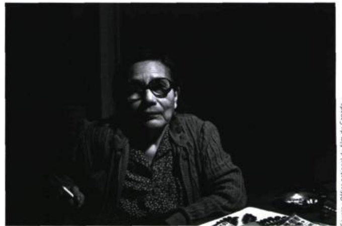
Le dernier glacier (1984)

Vous semblez avoir une manière assez unique de travailler. Je pense entre autres à la façon dont vous avez conçu Trois pommes... en élaborant en même temps l'histoire, la musique, la conception sonore. Cette méthode est-elle unique à ce film?