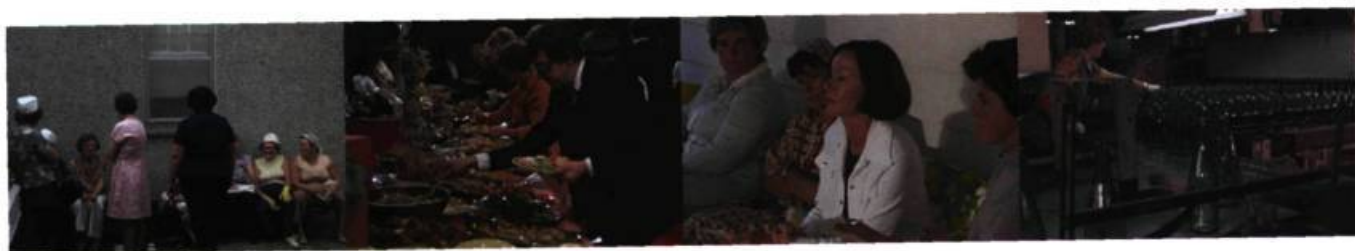
«Chronique de la vie quotidienne» Mercredi, petits souliers, petit pain (1977)