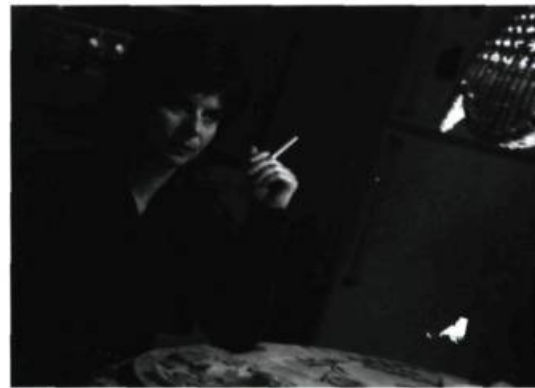
20h 17, rue Darling de Bernard Émond

C'est sans doute parce que je m'intéresse aux