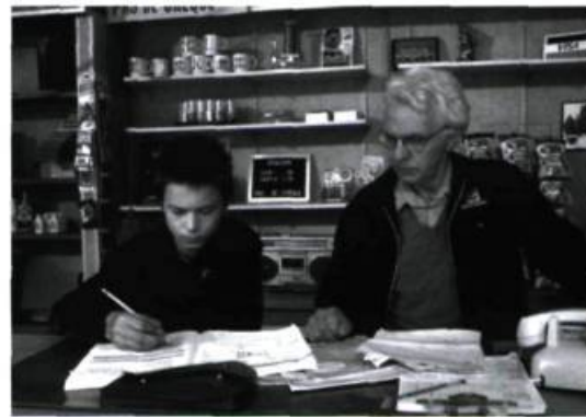
Gaz bar blues de Louis Bélanger