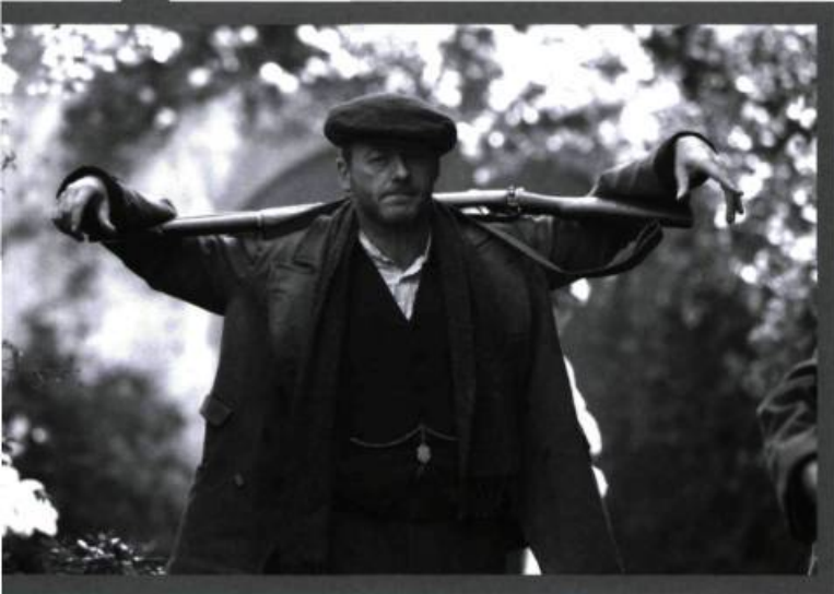
La palme d'or de cette année, Le vent se lève de Ken Loach.