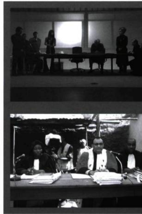
Southland Tales de Richard Kelly et Bamako d'Abderrahmane Sissako.