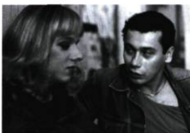
Pupendo de Jan Hrebek.