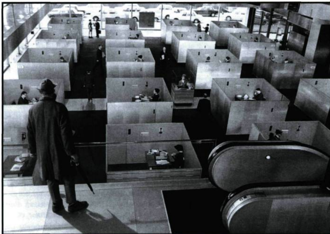
Playtime de Jacques Tati, ou la machine comme symbole d'une mésadaptation de l'homme à son environnement.

travail dans nos sociétés postindustrielles. L'exemple qui vient à l'esprit immédiatement est bien sûr Ressources humaines . Dans ce film, le rapport de l'homme à la machine garde son aspect humain, il est dédramatisé aussi, et le travail s'apparente davantage à la fonction de l'artisan. Car ce n'est plus la machine anthropomorphique, l'ancre de Metropolis , ni même, malgré le sujet du film, le médiateur de l'esclavagisme par lequel le patronat maintient ses troupes. Ici, la machine n'est qu'objet, outil de travail justement et filmée comme tel, pas très loin finalement d'un assemblage de tôles inanimées auquel l'ouvrier prête temporairement vie. D'ailleurs, le père ne répète-t-il pas d'une certaine façon les mêmes gestes qu'à l'usine, une fois chez lui, dans son sous-sol qu'il a aménagé en menuiserie? Si la dimension sociale est pourtant omniprésente dans le film, c'est bien plutôt à travers les rapports humains qu'il faut la chercher. Et si les gestes du père se ressemblent à l'usine et à la maison, c'est qu'il s'agit de ceux d'un vieil homme fatigué, usé, vidé de sa combativité par la vie et non par la machine.