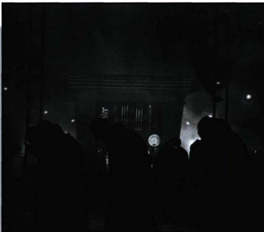
Les troupeaux de Metropolis engouffrés par la machine.

Progressivement cependant, l'ouvrier va désertier l'écran, au rythme où les sociétés industrielles voient le secteur secondaire de l'économie disparaître au profit du secteur tertiaire. Le règne des cols blancs et autres employés de services s'accompagne de modifications des conditions de travail et... de loisir. Le cinéma va dès lors illustrer ces fameux loisirs ( Une partie de campagne dès 1936 ou Les vacances de M. Hulot en 1953) puis plus tard, sur un mode beaucoup plus sombre, l'absence de travail. Chômage et exclusion vont occuper le devant de la scène. Exit la machine, les gestes du travail,