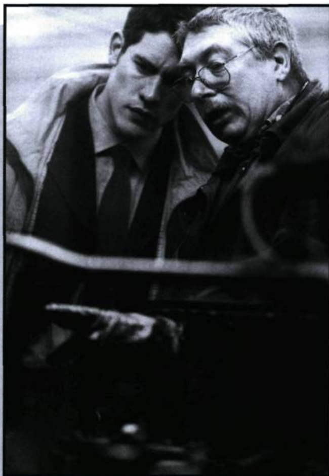
Ressources humaines de Laurent Cantet révèle un rapport dédramatisé de l'homme à la machine.

Il ne faudrait cependant pas trop s'attarder sur le cinéma de genre. À la base, les dés sont pipés puisque le cinéma de genre met en scène des spécialistes, et donc, bien souvent des métiers, et qu'il est fréquemment américain. Dans le cinéma américain, le travail reste une religion, plus que pour n'importe quel autre pays occidental: c'est d'ailleurs étonnant de constater comme, avec la triade travail, famille, État, on fait rapidement le tour d'une bonne partie de la production hollywoodienne. Souvent, un «héros» américain se définit d'abord par sa fonction et donc son travail, il est avocat, médecin, policier ou pompier et on le voit plus qu'à son tour dans l'exercice de ces fonctions. Ces mêmes fonctions déterminent son action dans le film. C'est l'une des significations que l'on peut trouver à Space Cowboy d'Eastwood. Nos braves papys de l'espace ne recouvrent leur identité qu'à partir du moment où ils redeviennent ces bons vieux méca-