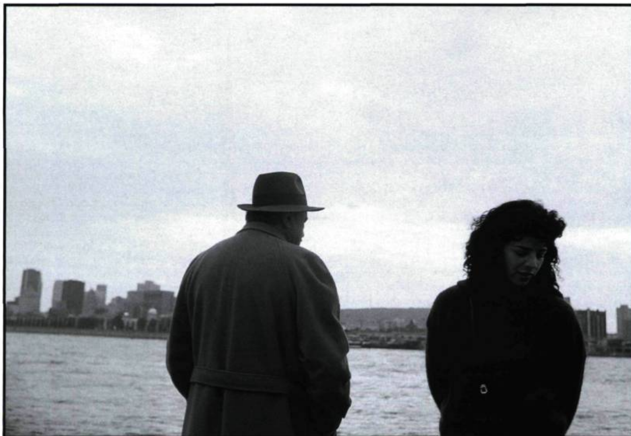
La position de l'escargot (1998). «Regarder par-dessus son épaule pour apercevoir la petite fille de ses souvenirs» dans un ailleurs toujours présent.