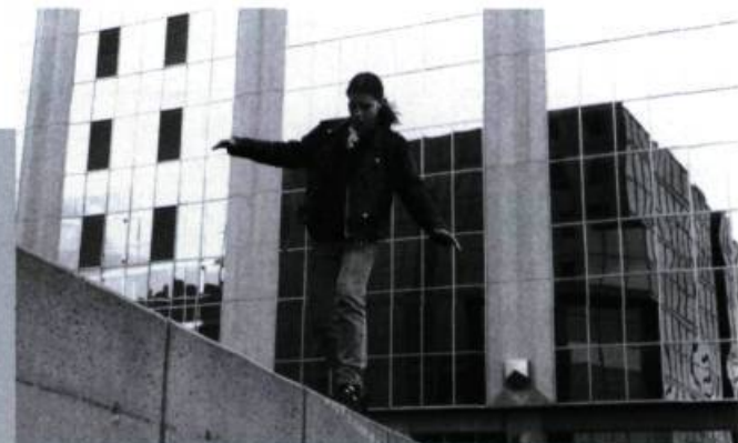
Seul dans mon putain d'univers.

son pays, Kramer est un pionnier: il défriche; il trace un chemin au réel pour que celui-ci parvienne jusqu'à nous. L'engagement, c'est bien se mettre au service du réel et non de la politique. — A.R.