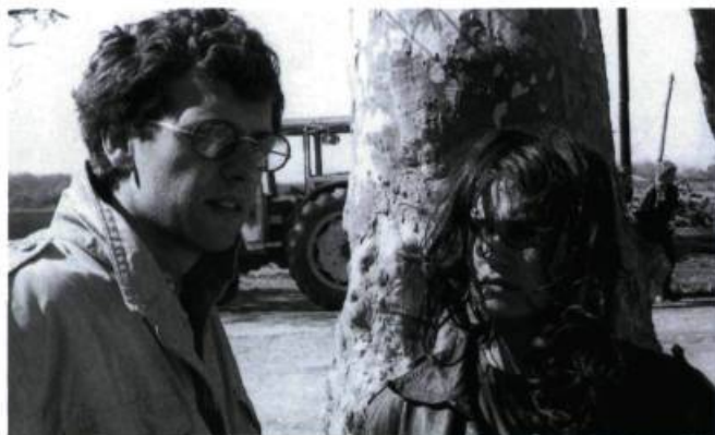
Sans toit ni loi.