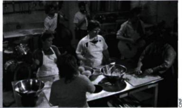
Au chic resto pop.

Après la chute du Mur de Berlin, un vieil espion se retrouvant brusquement sans emploi, cherche la route qui le conduira vers l'Ouest, mais ne rencontre que des «chemins qui ne mènent nulle part». À travers ce film crépusculaire, Godard, en héritier d'un monde effondré, porte un regard vitriolique sur nos sociétés contemporaines et sur les dérives (sinon la mort) d'une civilisation dominée par un mode d'organisation technico-économique. Radicalement actuel, Allemagne années 90, neuf zéro , à l'instar de tous les films