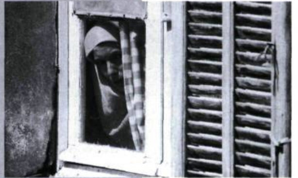
Bab el-Oued City.

du cinéaste, se donne à lire comme un troublant essai poétique sur les grandes mutations du monde moderne; mais il illustre aussi et surtout de façon magistrale ce mot de Deleuze selon lequel «créer n'est pas communiquer, mais résister». — M.-C.L.