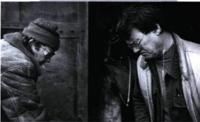
Le temps qu'il fait.

sans pitié (dans le portrait d'une société) et sans concession (sur le plan cinématographique). Dans ce «sans» se tient toute la morale de Kira Mouratova. — A.R.