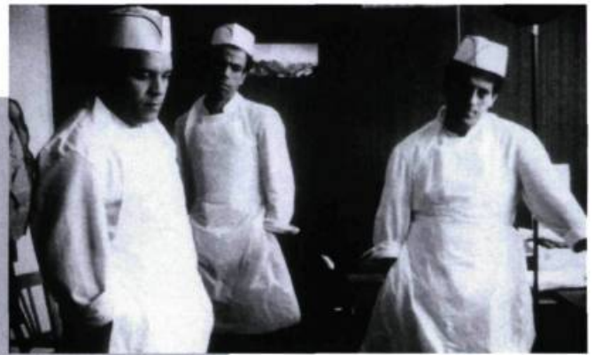
Coûte que coûte.

L'engagement de l'artiste face au réel ou la mobilisation ponctuelle. La création vue comme un acte signifiant généré par les circonstances politiques. Avec Bab el-Oued City , Merzak Allouache rend compte des heures sombres de l'Algérie d'après 1988 et du mal de vivre d'une jeunesse aux abois, tout en renouant avec la chronique urbaine à la Omar Gatlato (1976). L'énergie vitale comme antidote à toutes les dérives totalitaires. Un cinéma de résistance en pleine désillusion, ou quand la fiction a valeur prémonitoire... — G.G.