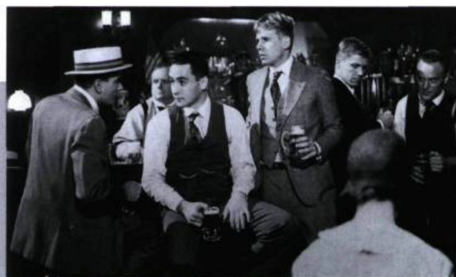
Eight Men Out.

dégage. Du pays cathare à l'Andalousie, Chahine prêche le dialogue et la lutte dans ce mélodrame flamboyant mâtiné de comédie musicale. Grand film populaire et non populiste, Le destin est aussi et surtout l'une des plus belles métaphores qu'il nous ait été donné de voir sur les intégrismes passés et présents qu'il renvoie dos à dos avec une sérénité et une fermeté que seuls possèdent les hommes de foi. Car Chahine ne donne pas l'impression de douter, il croit en l'homme et en sa mémoire, dans ce cas la pensée recueillie dans les livres (et dans les films). — P.G.