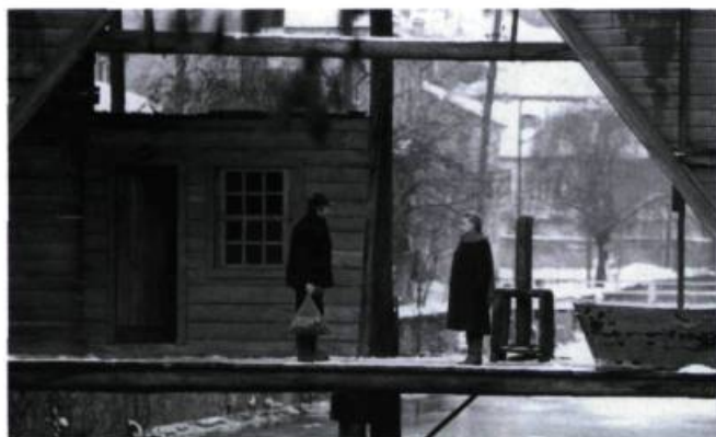
Le pas suspendu de la cigogne.