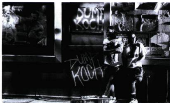
Do the Right Thing.