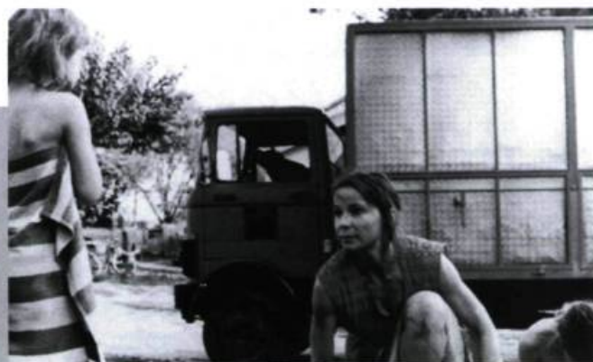
Y aura-t-il de la neige à Noël?

le cynisme et la responsabilité. Contre les formats courts de l'info-spectacle, le film parie sur la durée qui seule permet la nuance et la complexité. À rebours des idées reçues sur la pseudo-objectivité du prétendu cinéma-vérité, il rappelle que le documentaire est aussi un genre narratif: toute représentation du réel suppose un point de vue et une mise en scène, l'honnêteté du cinéaste consistant dès lors à ne pas préjuger de ce que sa caméra enregistre et à ne rien dissimuler des processus de fabrication du film. Intervieweur redoutable et monteur hors pair, Ophuls invente une forme extrêmement libre procédant par reprises, collages, recoupements et télescopages, et convoque la mémoire du cinéma sous forme de citations apportant un commentaire tour à tour ironique et mélancolique à la réalité filmée. Chez l'auteur du Chagrin et la pitié , l'engagement, de plus en plus affirmé, consiste d'abord à payer de sa personne, à se mettre en scène à l'écran, petit homme obstiné et caustique aux allures de privé de film noir — non par narcissisme mais pour montrer qui parle et d'où ça parle, comme on disait naguère — en ne s'épargnant pas plus qu'il n'épargne les autres. — T.H.