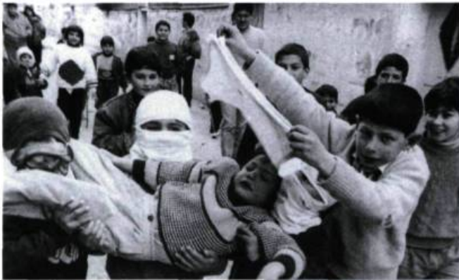
Les enfants du feu.