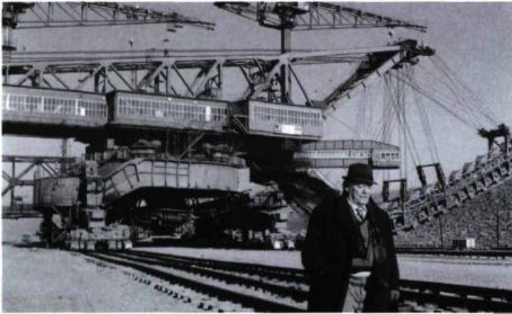
Allemagne années 90, neuf zéro.