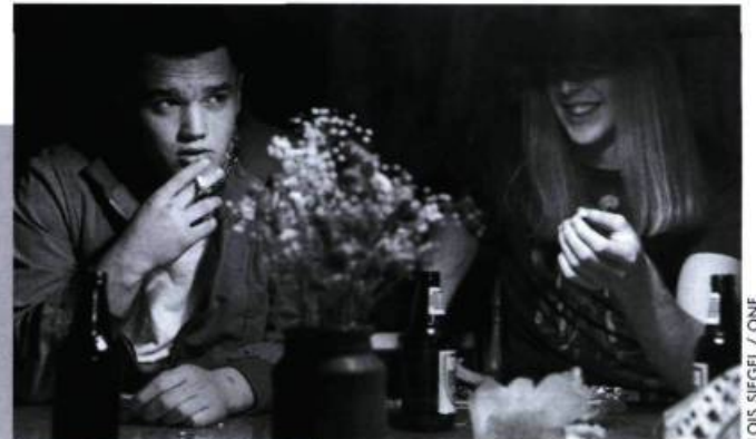
Train of Dreams.