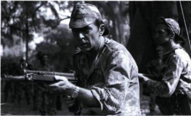
Non ou la vaine gloire de commander.