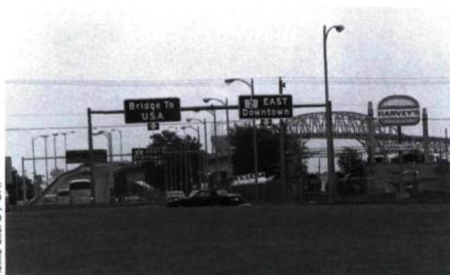
Voyage en Amérique avec un cheval emprunté.