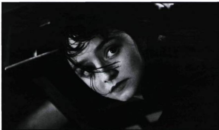
Deux frères, ma sœur de Teresa Villaverde (24 images n° 78-79).

Le ballon blanc Panahi Coûte que coûte Claire Simon Le temps de l'amour Makhmalbaf La baine Kassovitz Georgia Grosbard Crumb Zwigoff Casino Scorsese