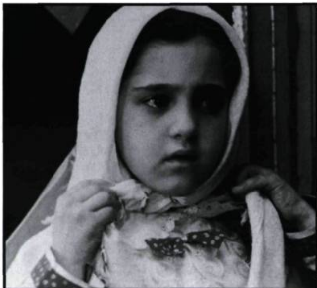
Le ballon blanc de Jafar Panahi (24 images n° 78-79).