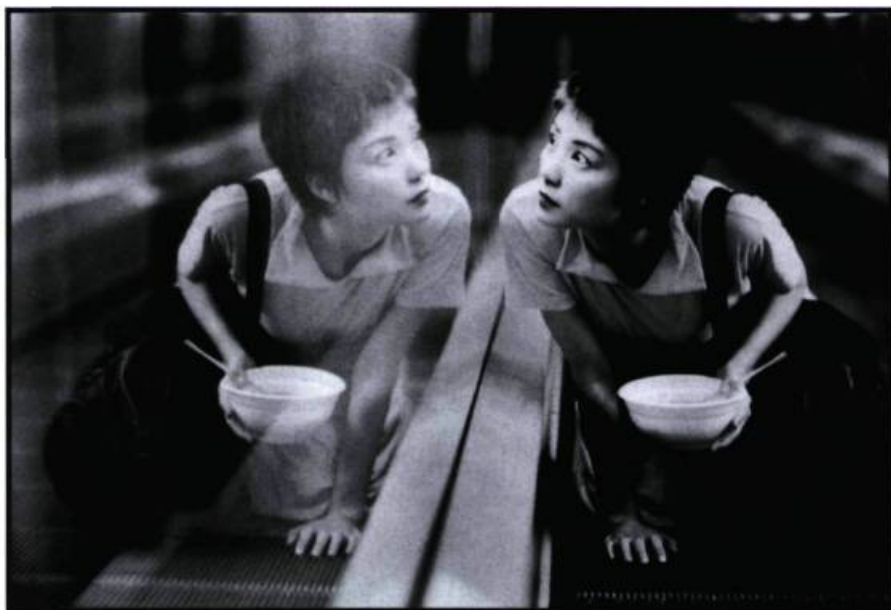
Chungking Express de Wong Kar-Wai (24 images n° 80).

par ordre alphabétique À la vie, à la mort Guédiguian Chungking Express Wong Kar-Wai Délits flagrants Depardon Deux frères, ma sœur Villaverde La cérémonie Chabrol Le couvent Oliveira Le fils du requin Merlet Little Odessa Gray Safe Haynes Sonatine Kitano