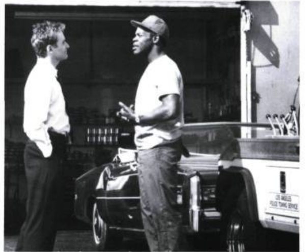
Kevin Kline et Danny Glover, Grand Canyon