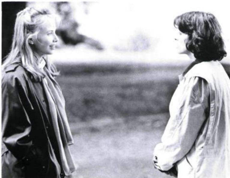
Rebecca de Mornay et Annabella Sciorra, The Hand that Rocks the Cradle