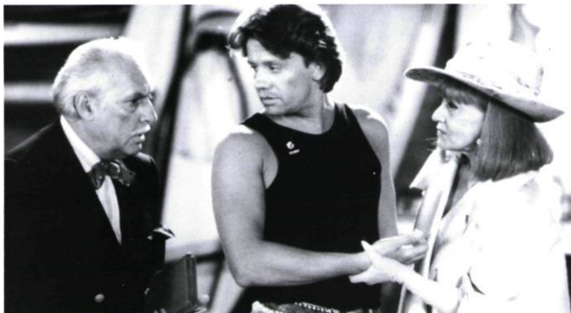
Michel Serrault, Luc Thuillier et Jeanne Moreau, La vieille qui marchait dans la mer