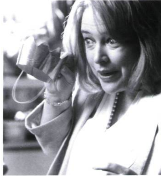
Kathy Bates, Fried Green Tomatoes

Fried Green Tomatoes , petit film des plaisirs maternels et des odeurs sucrées de la maison, raconte, à travers la narration de Jessica Tandy et par de nombreux flashbacks, l'histoire et la jeunesse mouvementée d'Idgie (Mary Stuart Masterson) et de son amitié incroyable avec Ruth (Mary-Louise Parker) dans un Alabama du début du siècle. Construit sur le dédoublement continu des situations et des personnages (Jessica Tandy et Kathy Bates réincarnant plus de 50 ans après la même amitié), ce film simple mais expressif ne laisse malheureusement rien, ni un verbe, ni une expression, ni un mouvement de caméra lui échapper, sortir de son registre «bon ton» politique. De la mise en scène de quatre actrices de tout âge, dont l'une est vieille, l'autre obèse, de l'interaction bénie et heureuse entre Blancs et Noirs, de la reconnaissance des États sudistes, du sort de la femme battue, du rôle social de l'Église, du sort des pauvres, des alcooliques et des déçus, rien n'est ici oublié (si ce n'est un certain «fiel» créateur et transcendant) pour plaire à une Amérique convalescente et susceptible. C'est dommage car le film possède d'indéniables qualités, dont la narration et le professionnalisme habituel des comédiens américains ne sont pas les moindres. (É.-U. 1991. Ré.: Jon Avnet. Int.: Kathy Bates, Jessica Tandy, Mary Stuart Masterson, Mary-Louise Parker) 130 min. Dist.: Universal. — O.D.