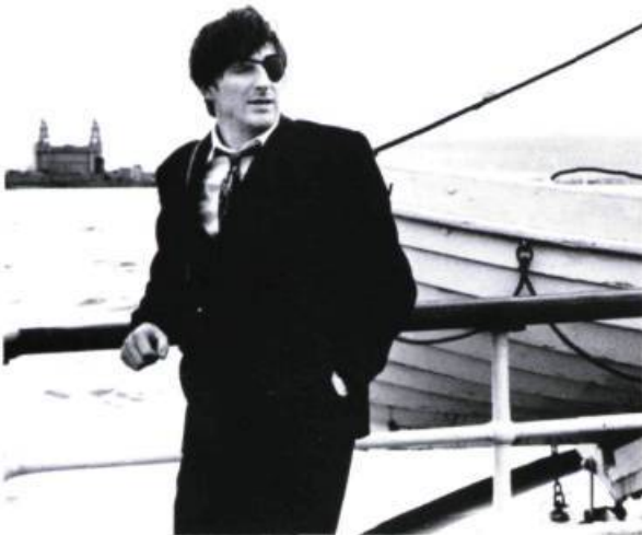
Adrian Dunbar, Hear my Song

Petite comédie attachante et sans trop de prétention, dont la mise en scène et la scénario, boiteux en fin de course, n'en obéissent pas moins à ce mouvement de fuite en avant qui nous épargne les développements inutiles et nous entraîne, presque à nos corps défendants et le plus directement possible, sur le