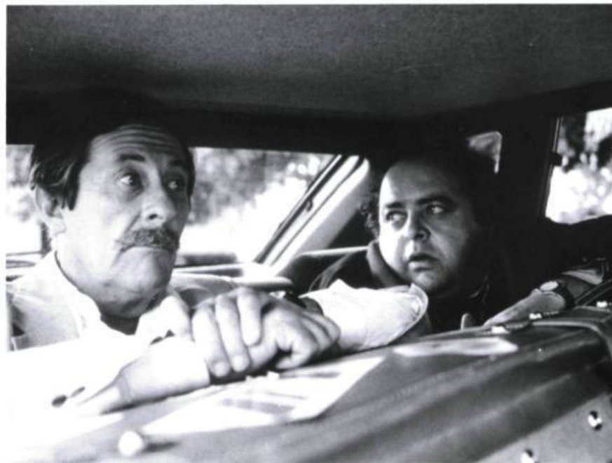
Jean Rochefort et Jacques Villeret, Le bal des casse-pieds

D'un constat élémentaire: 1. Ils sont partout, 2. À casse-pied, casse-pied et demi, 3. On est toujours le casse-pied de quelqu'un (et réciproquement), Yves Robert et Jean-Loup Dabadie ont voulu tirer l'inventaire exhaustif des importuns qui embouteillent nos existences. Dommage qu'ils se soient mis en tête de raconter quand même une histoire au lieu d'opter résolument pour un défilé débridé de saynettes. Car où le Dino Risi des Monstres ou même l'Yves Robert d' Un éléphant, ça trompe énormément (son dernier bon film) auraient fait mouche, le cinéaste et son scénariste hésitent entre le film à sketches (trop gentils) et la comédie sentimentale à quiproquos (juste ébauchée). À quelques éclats de rire près, la grande parade des raseurs de haut vol, crampons et pompeurs d'air, gonfleurs dilettantes et chieurs professionnels, emmerdeurs occasionnels et fâcheux définitifs tourne à la revue des gags ayant servi au moins 4857 fois à l'écran (au secours, la baignoire qui déborde!). L'observation des mœurs et des tics de langage date déjà, la collection des nouveaux cuisiniers et des nouveaux divorcés, des maniaques de la Bourse et autres obsédés du constat à l'amiable est décidément trop gentiment croquée, l'ensemble manque terriblement de loufoquerie et de férocité,