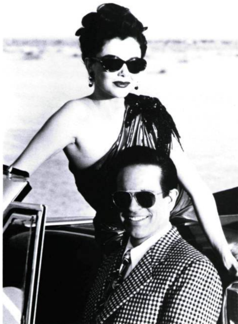
Annette Bening et Warren Beatty, Bugsy