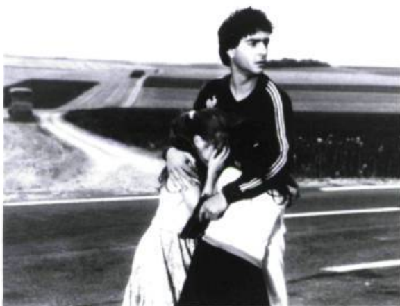
Yvan Attal, Aux yeux du monde