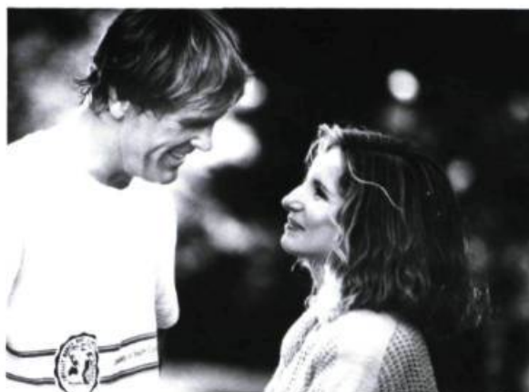
Nick Nolte et Barbra Streisand, The Prince of Tides