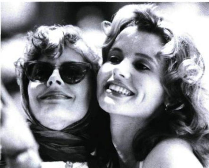
Susan Sarandon et Geena Davis, Thelma & Louise

Après Black Rain , thriller paranoïaque aux relents fascinants, on attendait le pire de Ridley Scott, cinéaste plutôt habile dans l'efficacité et la sophistication, mais, semble-t-il, irrémédiablement soumis au chant des sirènes de l'esthétique pub. Sans échapper complètement à ce travers sclérosant, ou plutôt en l'utilisant à meilleur escient, Thelma and Louise assure et rassure. Servi par un scénario honorablement ficelé (Callie Khouri), qui privilégie l'étude de caractères, Ridley Scott abandonne les «polars» sur fond de mégapoles — futuristes ou non —, pour ancrer son récit dans une réalité plus ordinaire et, surtout, plus humaine. Non pas que le décor (les grands déserts de l'Utah) ne revêtent pas encore ici un rôle fictionnel de premier plan, mais au moins ouvre-t-il sur un espace de liberté, aussi dérisoire soit-il, qui, pour une fois, n'écrase pas l'homme, ne l'avilit pas. Deux Américaines moyennes partent en week-end pour échapper à la morosité du quotidien et au degré zéro de leur vie affective. Tentative de viol dans un parking, coup de feu malencontreux, et le récit s'emballa au rythme de la cavale tragi-comique des deux souris,