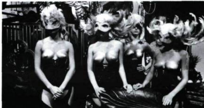
Jours tranquilles à Clichy

Quelle obscure combine de production dont Chabrol a le secret a pu donner naissance à cet aberrant Jours tranquilles à Clichy ? Non seulement l'univers d'Henry Miller reste complètement étranger à l'auteur de Masques qui semble du reste s'en moquer éperdument, mais si le film retourne contre elle-même l'absurdité des coprodes européennes, c'est sans même y mettre la rage ou la jubilation avec laquelle Chabrol s'est déjà plu, dans ses besoins alimentaires, à aller, selon ses mots, «dans le sens de l'idiotie du sujet». Reste l'élégance réelle d'un style immédiatement reconnaissable dès le prologue, mais ici totalement dépourvue d'objet. Miller à l'article de la mort ressasse son dégoût à l'adresse d'une jeune Parque dénudée, puis le film