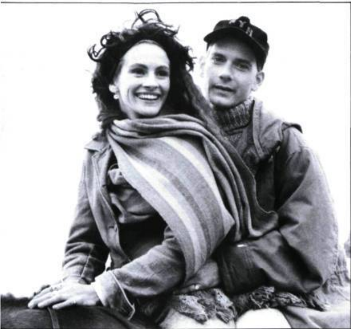
Julia Roberts et Campbell Scott, Dying Young