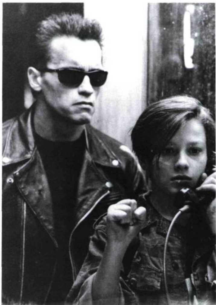
Arnold Schwarzenegger et Edward Furlong, Terminator 2: Judgment Day