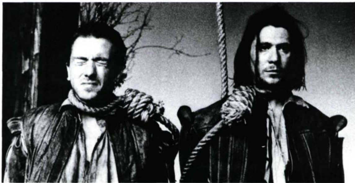
Tim Roth et Gary Oldman, Rosencrantz and Guildenstern are Dead