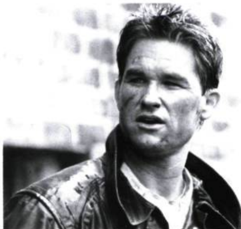
Kurt Russell, Backdraft