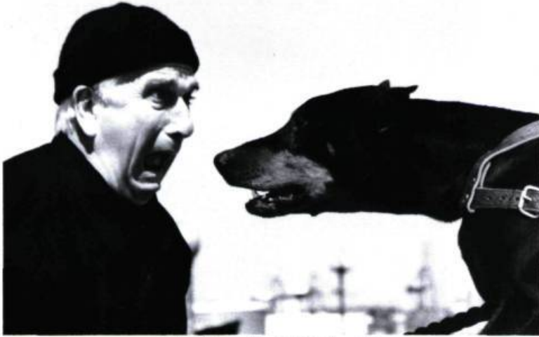
Leslie Nielsen, The Naked Gun 2 1/2