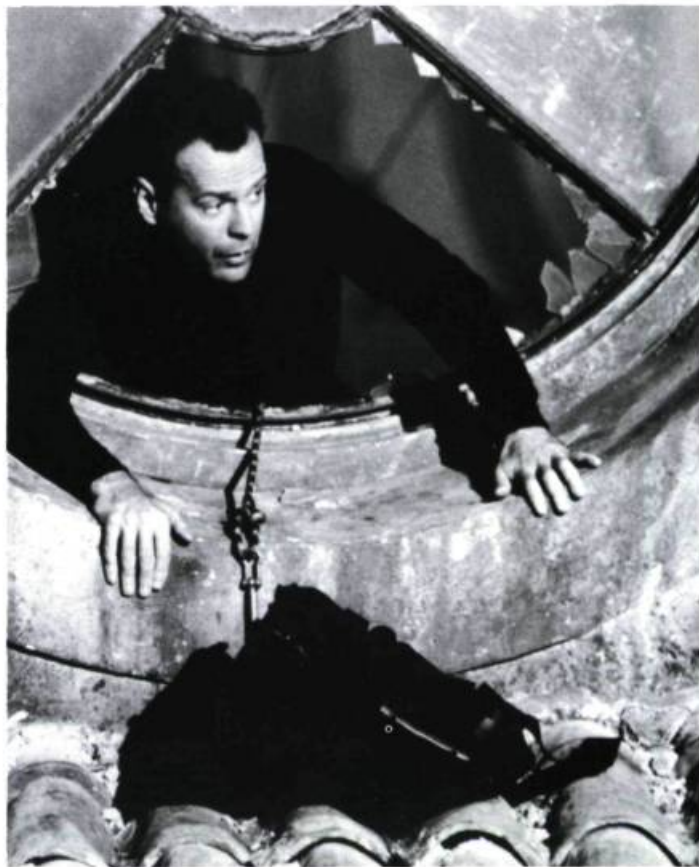
Bruce Willis, Hudson Hawk