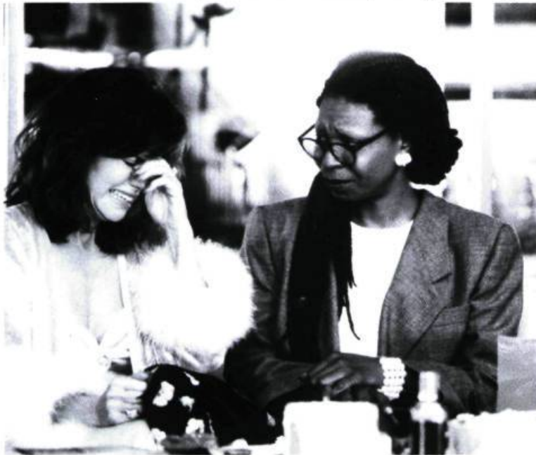
Sally Field et Whoopi Goldberg, Soapdish

succès intitulée The Sun Also Sets . De chaque côté de la caméra se multiplient donc les revirement mélodramatiques, les trahisons, les histoires d'orphelines retrouvées et les crises d'hystérie. Et, comme tout bon soap, le film comporte aussi un «very glamorous casting»: Sally Field, Kevin Kline, Robert Downey Jr., Cathy Moriarty, Whoopi Goldberg, Carrie Fisher et même Garry Marshall, le réalisateur de Pretty Woman .