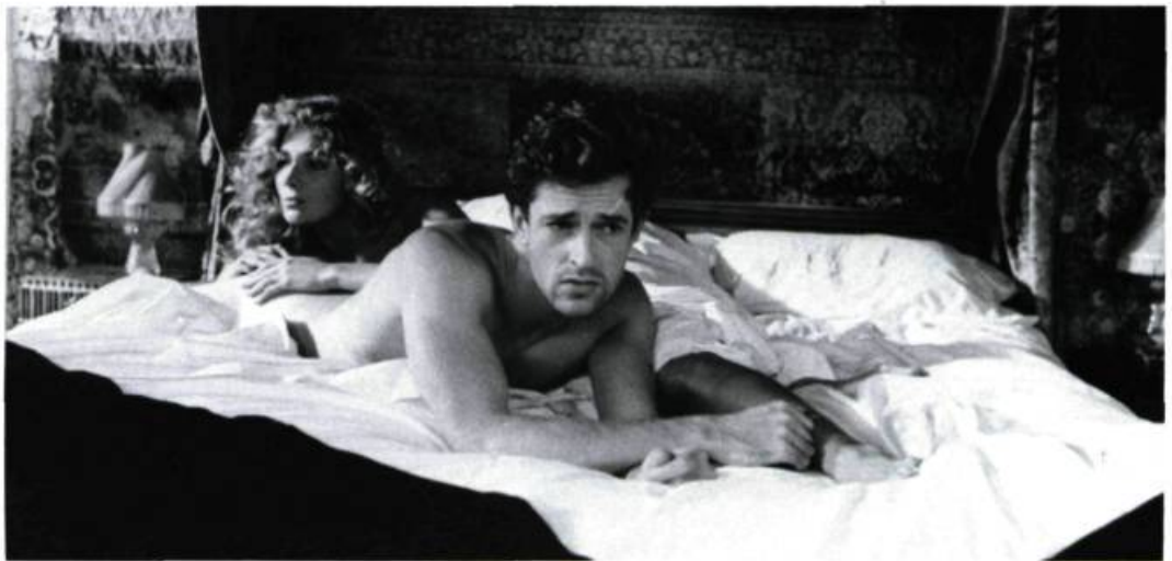
Natasha Richardson et Rupert Everett, The Comfort of Strangers