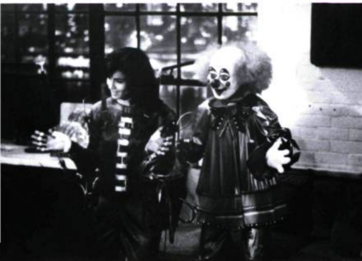
Rachel Ticotin, F/X 2 ...

On le sait, particulièrement depuis Spielberg et Lucas, les effets spéciaux portent sur leurs épaules la responsabilité d'une grande partie de l'industrie cinématographique américaine, c'est-à-dire presque tout le cinéma hollywoodien. Sans le progrès technologique et les trucages ultrasophistiqués assurant une certaine créativité et une rentabilité plus que satisfaisante, le cinéma du samedi soir que nous envoie l'Amérique aurait péri il y a des lustres. Reconnaisant sa dette envers ces joujoux miraculeux, donc film révérencieux en quelque sorte, F/X 2 met en scène un expert des effets spéciaux entraîné dans une affaire de meurtre impliquant des policiers corrompus.