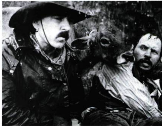
Bruno Kirby et Billy Crystal, City Slickers

toute la famille». C'est déjà beaucoup par les temps qui courent... (É.U. 1991. Ré.: Ron Underwood. Int.: Billy Crystal, Bruno Kirby, Daniel Stern, Jack Palance, Helen Slater.) 115 min. Dist.: Columbia. — G.P.