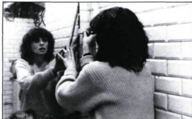
Juliet Berto dans Neige (1981), son premier film en tant que cinéaste

Elle était ici il y a trois ans, invitée du Festival des films de femmes qui présentait ses trois films de cinéaste et quelques-uns de ses films d'actrice. Elle n'avait jamais foulé le sol de Montréal, et de la voir déambuler dans nos rues familières paraissait un peu irréel. Juliet Berto, ce n'était pas une célébrité susceptible de créer un séisme. C'était une actrice de Godard, de Rivette, de Losey, simplement, et plus tard une passante chez Doillon, entre quelques autres. Puis la cinéaste de Neige, Cap Canaille et Havre, films du Sentier à Paris et de ports de nulle part, là où fleurit toujours un peu le danger. C'est cette dernière période qu'elle revendiquait surtout, Godard et les autres c'était des souvenirs merveilleux, voilà tout. Et personne ne pouvait imaginer alors qu'elle nous laisserait si tôt le sien, de souvenir merveilleux.