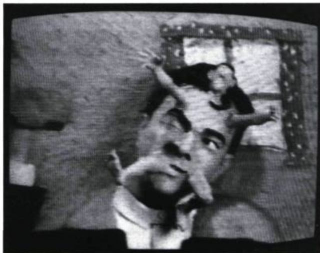
Hommage à Méliès

Sledgehammer de Peter Gabriel réalisé par Steven Johnson