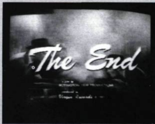
The Girl I Used to Know de Danny Wilson