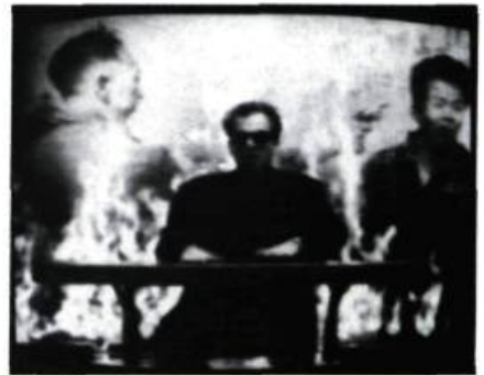
We Didn't Start the Fire de Billy Joel réalisé par Chris Blum