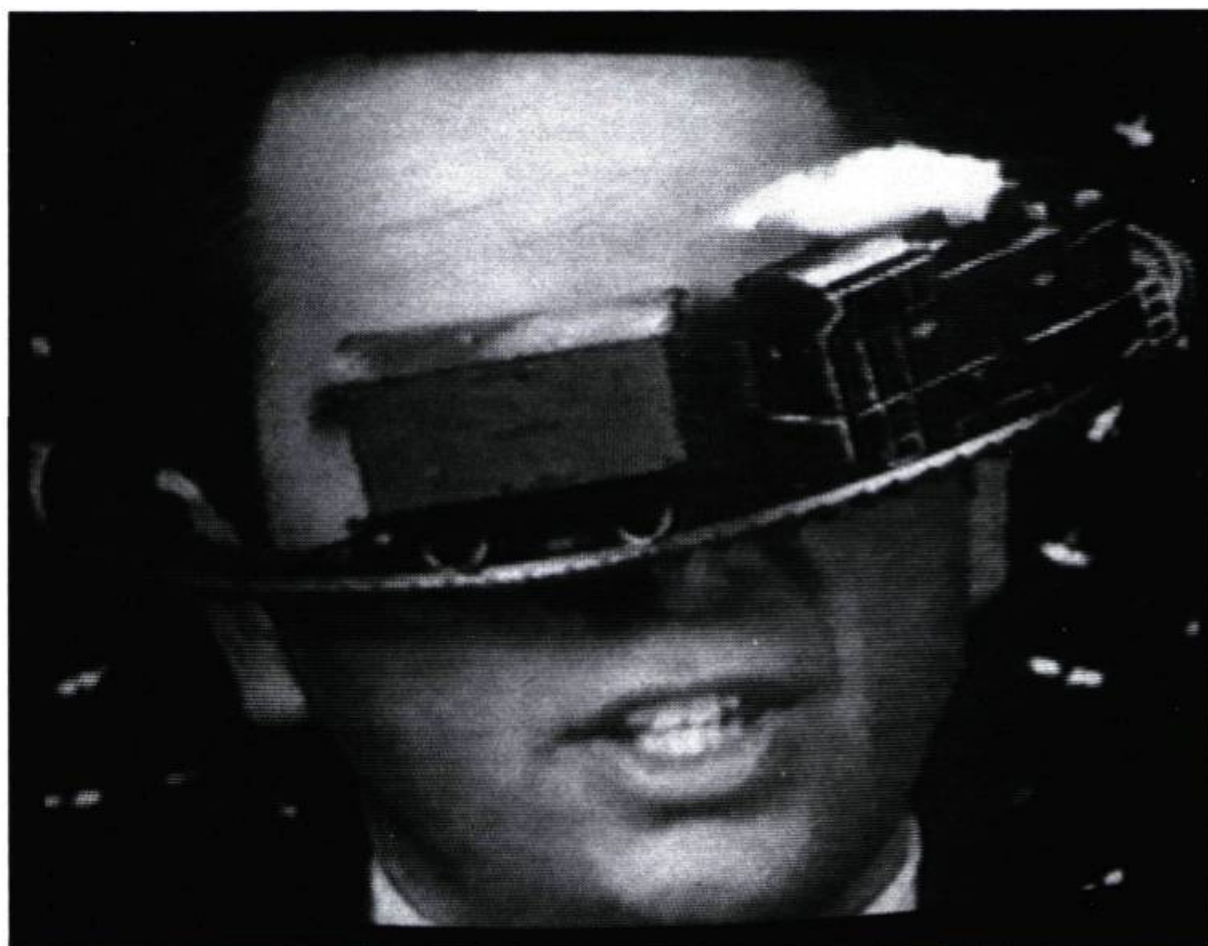
Peter Gabriel dans Sledgehammer , une réalisation de Steven Johnson