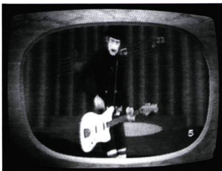
C'est comme ça des Rita Mitsouko réalisé par Jean-Baptiste Mondino