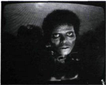
Michael Jackson dans Thriller, une réalisation de John Landis