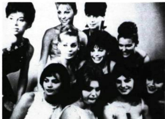
Les années déclin de Raymond Depardon (1984)