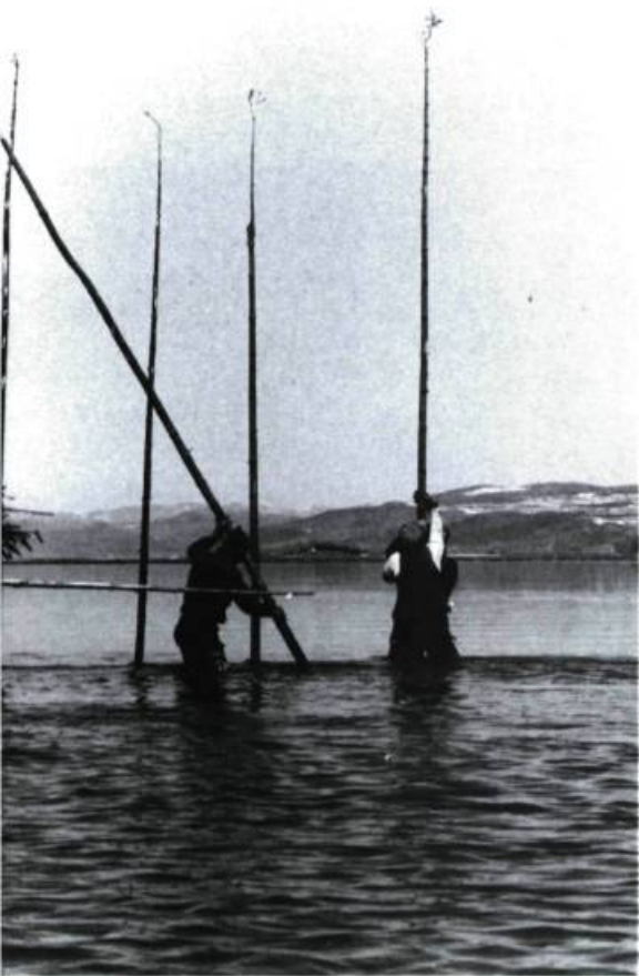
Pour la suite du monde de Pierre Perrault et Michel Brault (1963)