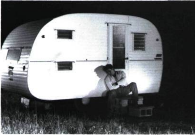
Roy Dupuis, Sortie 234 .