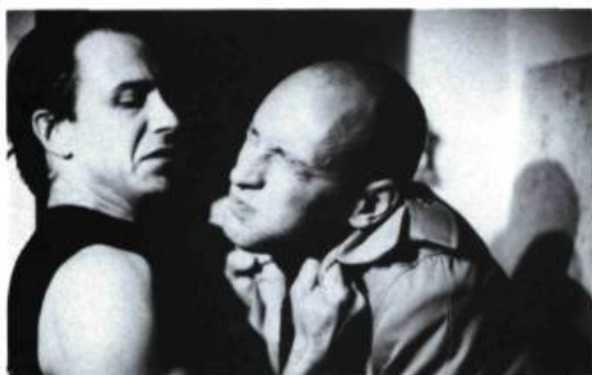
Un zoo la nuit de Jean-Claude Lauzon. Un budget de 1,9 million pour ce premier long métrage québécois.

les éventuels revenus par des cachets en différé. Ce qui entre en conflit avec les structures de production que vous avez établies. Ça crée au départ une grande différence dans la nature des projets acceptés.