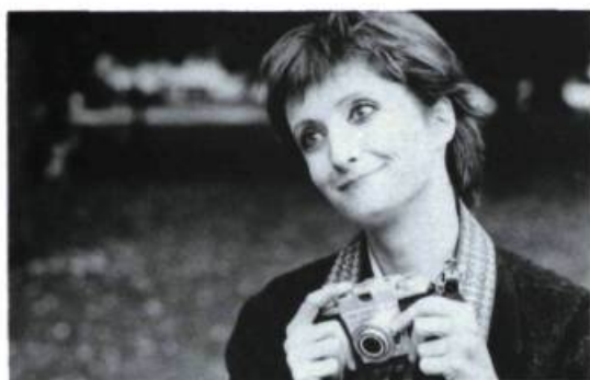
I've Heard the Mermaids Singing de Patricia Rozema. Un budget d'environ 350 000$.