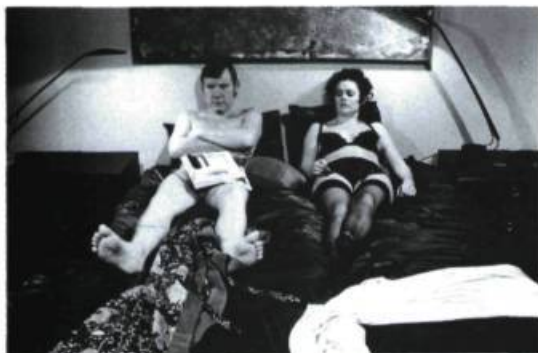
Family Viewing de Atom Egoyan. Un budget de moins de 200 000$.

Les longs métrages ontariens Family Viewing et I've Heard the Mermaids Singing ainsi que le long métrage québécois Un zoo la nuit sont les trois productions canadiennes à s'être distinguées sur la scène internationale en 1987.