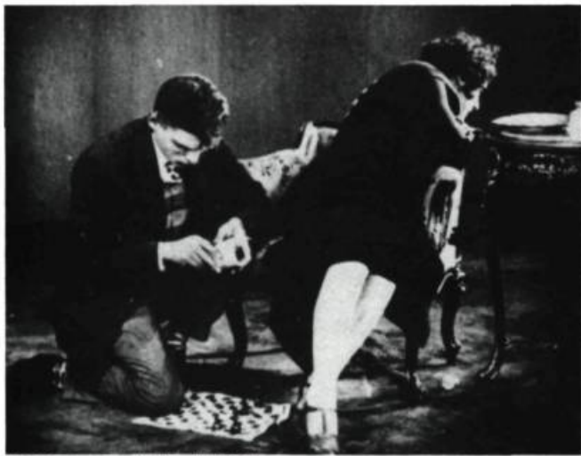
La fièvre des échecs de V. Poudovkine, URSS, 1925.