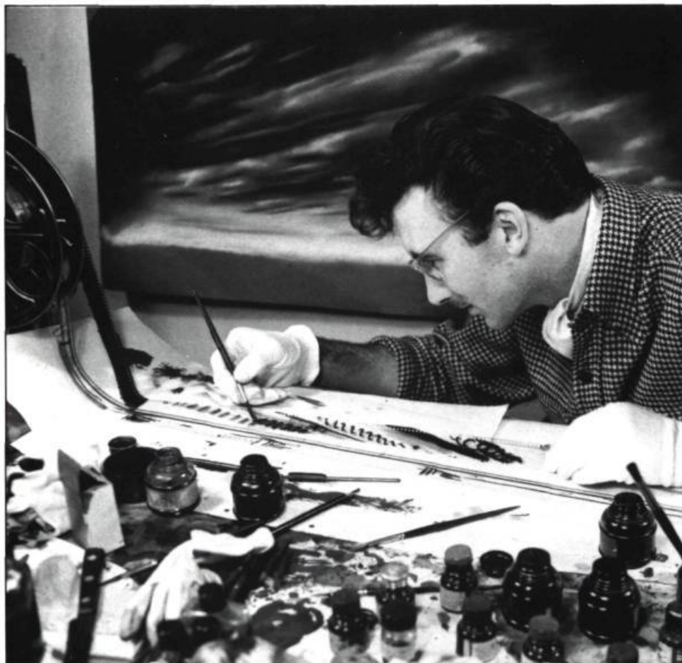
McLaren réalisant Fiddle-De-Dee