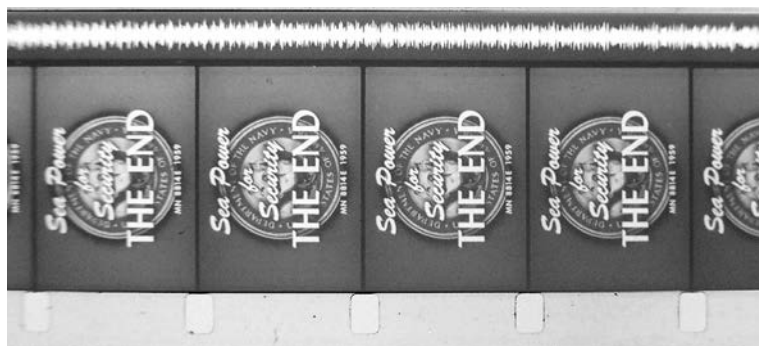
Fig. 2: Bande de son optique sur film 16mm (U.S. Navy training film, 1959).

14 ordre dans le reformatage de la sensibilité et de la temporalité modernes. Elle semble singulièrement répéter au 20 e siècle les inflexions qui furent, aux précédents, celles des techniques d'orientation spatio-temporelle : d'abord optique et mécanique, puis électrique et électronique. Rappelons que l'hétérogénéité d'ordre physique entre l'image, qui n'existe qu'en tant qu'artéfact de dimension spatiale, et le son, vibration constituée par une oscillation dans le temps, rend leur synchronisation – que notre cerveau effectue spontanément 8 – particulièrement complexe. De plus, en raison de la sensibilité plus importante de notre oreille aux variations de fréquences que de celle de notre œil aux différences de vitesse du mouvement, c'est toujours l'audition qui détermine pour le récepteur la qualité d'une synchronisation. Il s'agit là d'un point que l'on peut particulièrement mettre en relief quand on compare la sonorisation au théâtre à la pratique généralisée du synchronisme au cinéma, comme le fait ici Daniel Deshays à partir de son expérience de créateur sonore.