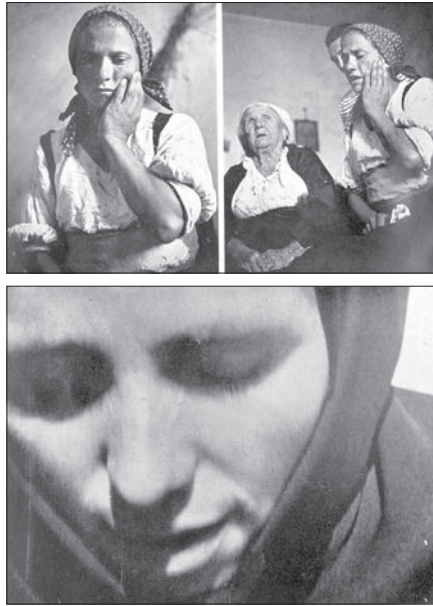
Fig. 4 et 5: « Atlante figurato del pianto », section Materiale folklorico , étapes successives d'une lamentation funèbre artificielle, Lucania (haut); photogramme d'une lamentation funèbre artificielle, Sardaigne (bas) (De Martino, 1958, Fig. 5a,b et 6b).

antico . Dal lamento pagano al pianto di Maria 61 , qui se termine par un surprenant « Atlas figuré de la lamentation » ( Atlante figurato del pianto ) composé de 66 images. Le titre n'est évidemment pas sans rappeler l'atlas Mnemosyne de Warburg (inachevé, 1929), et fait contraste avec le vocabulaire anthropologique de cette époque 62 .