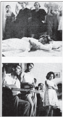
Fig. 3 : « Entre deux cycles de danse, la tarentulée se repose. » ; « ... Parents et public suivent le déroulement du cycle et y participent d'un air préoccupé » (Fig. 25, 26).

les textes antiques exclusivement écrits, de Pline 54 à Eschyle, en passant par Platon. Et pourtant, il parle de l' « image » d'Io. Les propos de Faeta sont éclairants sur ce rapport entre mots et images et la curieuse tension qu'il engendre :