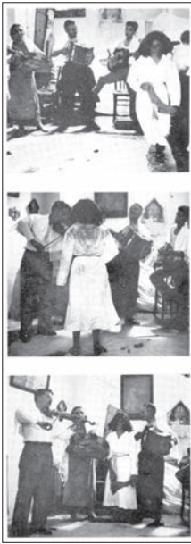
Fig. 2 : « ... et se met à parcourir le périmètre cérémoniel » ; « ... parfois elle s'arrête devant ou parmi les musiciens afin de "prendre" des sons » (De Martino, 1966, Fig. 5, 6, 7).