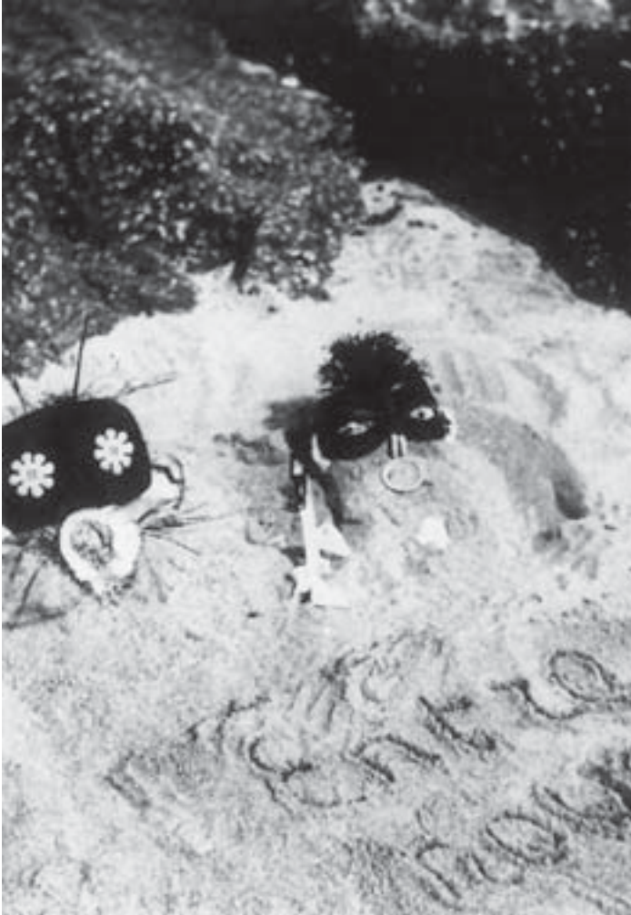
Fig. 10. Claude Cahun, Entre nous , 1926, Galerie Berggruen.

historiques de la « nouvelle femme » et du désir lesbien soulevaient comme question fondamentale commune, c'était la nécessité de repenser la norme hétérosexuelle sur les plans philosophique, médical, social et politique, de comprendre cette nouvelle apparence et la pratique érotique qui lui est associée comme la déstabilisation des frontières assignées entre les deux sexes, de les accepter comme la crise des catégories perçues volontiers comme stables, de