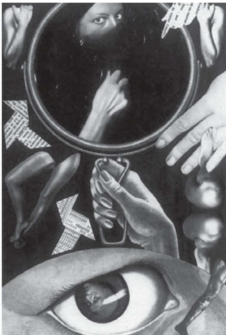
Fig. 8. Claude Cahun, Marcel Moore, Aveux non avendus, Tableau III , Photomontage, 1929-1930, coll. privée (avec l'aimable autorisation de la Galerie Zabriskie, New York).