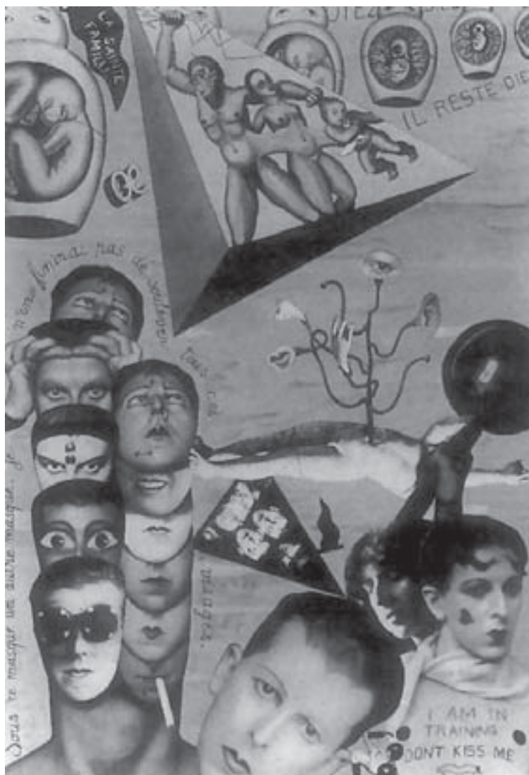
Fig. 5. Claude Cahun, Marcel Moore, Aveux non avendus, Tableau X , Photomontage, 1929-1930, coll. privée (avec l'aimable autorisation de la Galerie Zabriskie, New York).