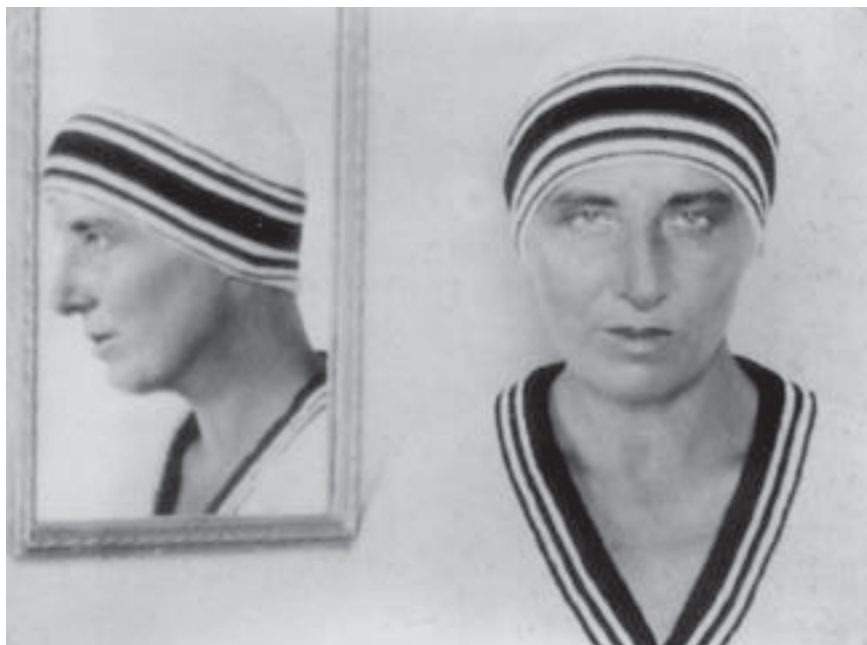
Fig. 2. Claude Cahun, Suzanne Malherbe , 1928, coll. privée, Paris.

la montre habillée d'une veste en motif à damier blanc et noir est, en vérité, indissociable de l'(auto)portrait « Suzanne Malherbe », réalisé par ailleurs la même année, sur lequel elle porte un pull-over et un bonnet blancs rehaussés tous deux par des rayures noires et blanches (fig. 2) 22 . Loin de vouloir se ressembler comme des jumelles siamoises, loin donc aussi du mythe de Narcisse et de sa sœur — je reviendrai sur ce point crucial de l'interprétation des autoportraits et des photomontages 23 —, le moi et son alter ego affichent leur différence dans