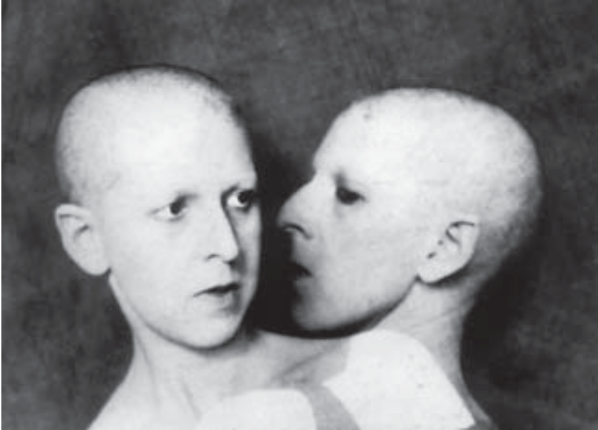
Fig. 9. Claude Cahun, Que me veux-tu ? , 1928, coll. privée, Paris.

informant sur la relation « privée-publique 43 » qu'entretenait le couple avec ses photographies, la question demeure entière. Mais elle nous amène sur un autre terrain, celui de l'opinion publique face au désir lesbien.