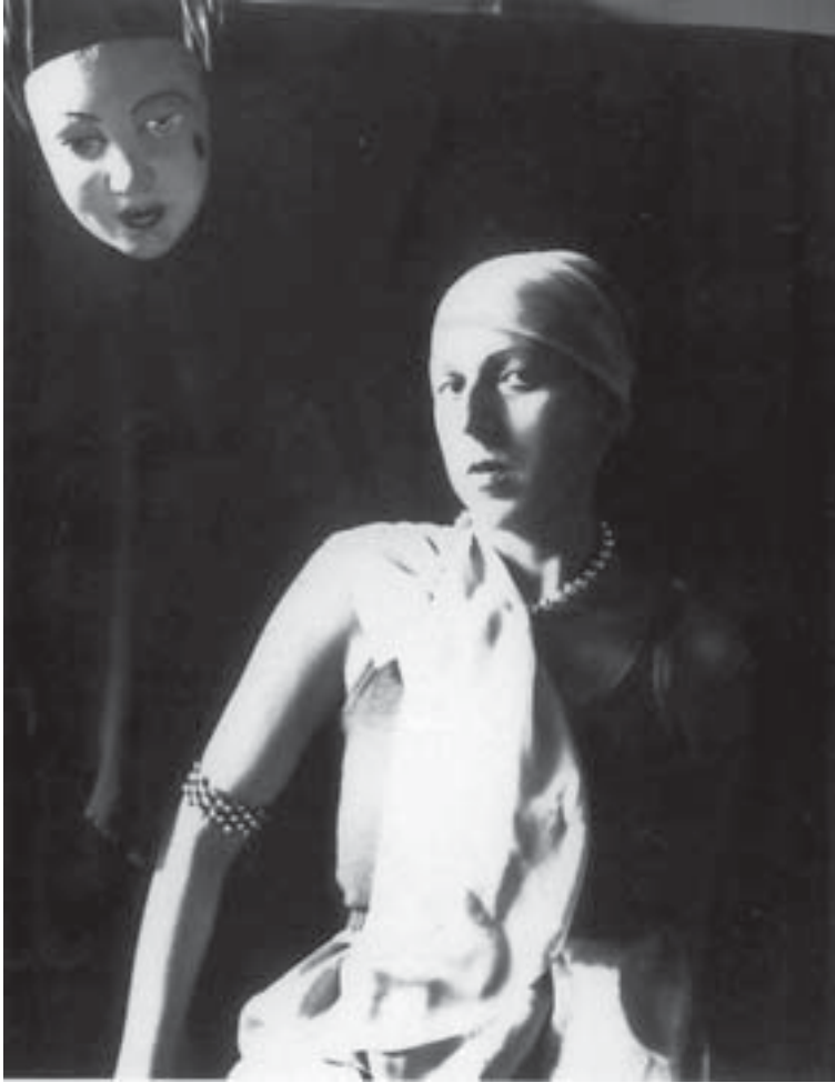
Fig. 6. Claude Cahun, Autoportrait , vers 1928, coll. Musée des Beaux-Arts, Nantes.

copie. Il est vrai que le motif du double est omniprésent dans les autoportraits réalisés entre 1912 et 1947. C'est grâce au jeu des masques que le « je » se dote toujours de nouveaux visages. La célèbre phrase, souvent citée depuis, insérée dans le « Tableau X » (fig. 5), rend ces mascarades explicites : « Sous ce masque un autre masque. Je n'en finirai pas de soulever tous ces visages. » (ANA, p. 212) Cependant, à force de trop s'amuser avec les masques, la décalcomanie peut réserver des surprises :