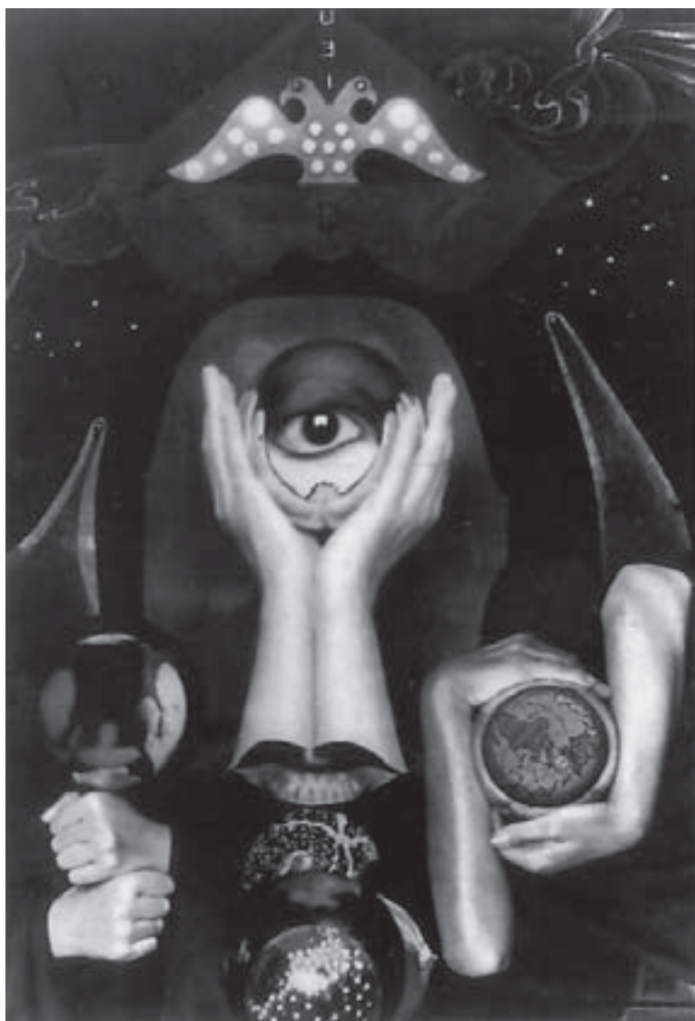
Fig. 4. Claude Cahun, Marcel Moore, Aveux non avenues, Tableau 1 , Photomontage original, 1929-1930, coll. National Gallery of Australia, Canberra.