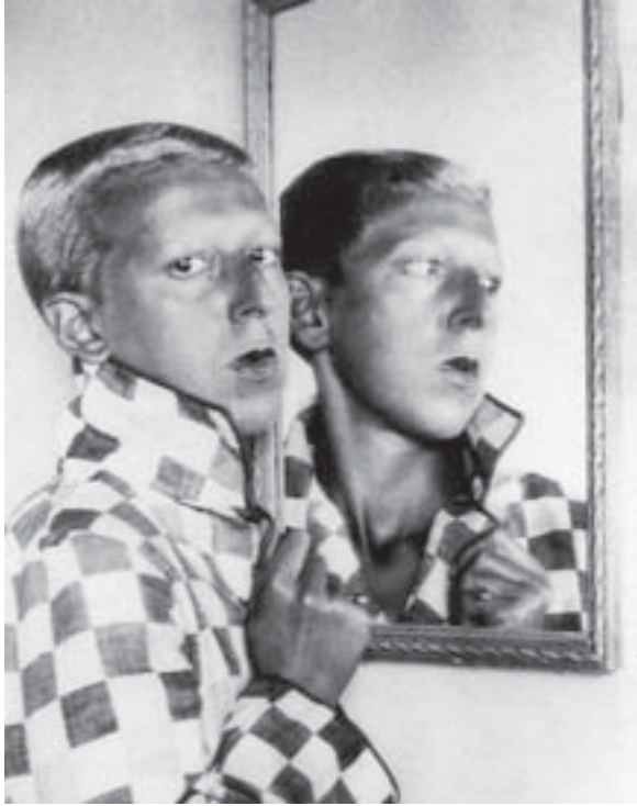
Fig. 1. Claude Cahun, Autoportrait , 1928, coll. Musée des Beaux-Arts, Nantes, coll. privée, Évreux.

complémentarité entre Cahun et Moore, il faut s'attarder sur les détails de leur autoreprésentation qui emprunte le plus souvent la voie de l'autoportrait photographique. L'emblématique « Autoportrait 21 » (fig. 1) de Claude Cahun devant un miroir, aux cheveux courts et au regard tourné vers le spectateur, qui