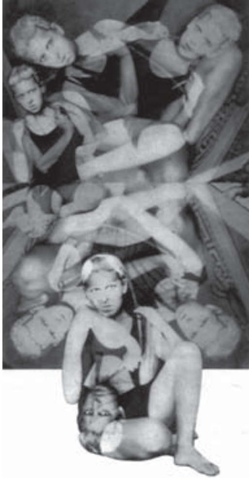
Fig. 7. Claude Cahun, Marcel Moore, Aveux non avenues, Tableau IX , Photomontage, 1929-1930, Éditions du Carrefour, Paris.

Le mythe de Narcisse est partout. Il nous hante. Il a sans cesse inspiré ce qui perfectionne la vie, depuis le jour fatal où fut captée l'onde sans ride. Car l'invention du métal poli est d'une claire étymologie narcissienne. Le bronze — l'argent — le verre : nos miroirs sont presque parfaits. (ANA, p. 38)