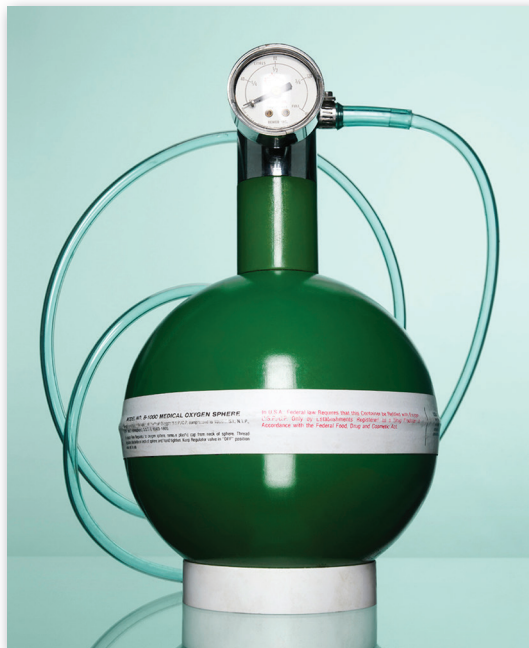
Réservoir d'oxygène, circa 1960.

sur la valeur de la collection que sur le rôle et la responsabilité du CUSM face à cette dernière ainsi que la meilleure façon de procéder afin de la protéger. D'une part, la collection valait-elle la peine d'être préservée et si oui, pourquoi était-il pertinent de laisser ces artéfacts au sein de leur institution d'origine plutôt que de les confier à un musée? Et si le CUSM prenait la décision de garder son patrimoine au sein de ses établissements, comment alors justifier qu'une institution dédiée aux soins de santé se dote également d'une collection et des responsabilités de sauvegarde et de diffusion du patrimoine?