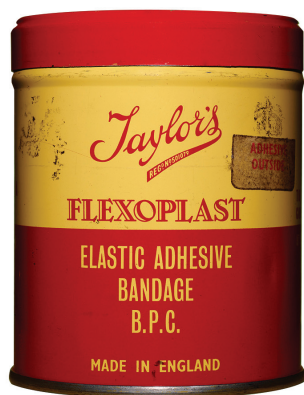
Boîte de pansement, date inconnue.

En 2007, le Centre universitaire de santé McGill (CUSM) se préparait à mettre en œuvre son projet de redéploiement selon deux objectifs. Dans un premier temps, il fallait intégrer trois hôpitaux universitaires, le Centre du cancer des Cèdres et l'institut de recherche dans un nouveau complexe hospitalier de fine pointe situé dans l'arrondissement Notre-Dame-de-Grâce, à Montréal. Par la suite, il s'agissait de réaliser la réfection de l'Hôpital de Lachine et de l'Hôpital général de Montréal. Dans ce contexte, le projet patrimonial du CUSM – devenu ensuite le Centre d'exposition RBC du CUSM – est né afin de préserver le patrimoine et la culture matérielle des hôpitaux du centre hospitalier lors des déménagements et des travaux de construction de ces établissements.