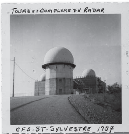
Tours et complexe du radar de « Canadian Forces Station (CFS) » Saint-Sylvestre, propriétaire Kathleen Moors, date : 1957, auteur : inconnu

Des activités étaient organisées à la station pour améliorer la vie sociale des habitants : compétitions sportives, parties de sucre, journées d'aviation, etc. Toutes ces activités sociales ont contribué à rendre plus agréable la relation entre paroissiens et militaires dans ce véritable petit village. Durant ses grands rassemblements, la population s'élevait à 800 personnes, femmes et enfants compris. Seulement 200 à 300 étaient des militaires. Le village était constitué d'une multitude de bâtiments. À l'entrée de la base se trouvait le poste de police où l'identification des personnes et des objets était obligatoire, tant à l'entrée qu'à la sortie. L'édifice d'administration regroupait les bureaux