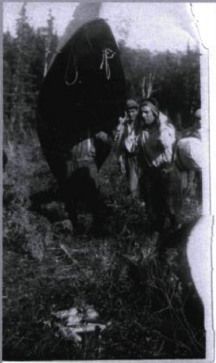
Portage en forêt.

On ne traduit pas une langue pour un autre peuple qui n'a pas la même vie, et qui n'aurait jamais su fabriquer un seul mot pour l'expliquer et dire en quelques syllabes : « pepkutshukatteu » / « la toile de ma tente est trouée de cent étincelles du bois crépitant de mon petit