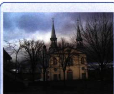
Église Saint-Charles-Borromée de Charlesbourg.

« Dans ces "temps anciens", les paroisses au nord de la ville de Québec n'étaient pas nombreuses; la paroisse de Charlesbourg était bornée au sud par la paroisse St-Roch de Québec, à l'est par la paroisse de Beauport et à l'ouest par la Paroisse de l'Ancienne-Lorette. Au nord, la paroisse de Charlesbourg s'étendait jusqu'à l'arrière pays... du Saguenay (...) les débuts de Charlesbourg remontent à 1660. » 2 .