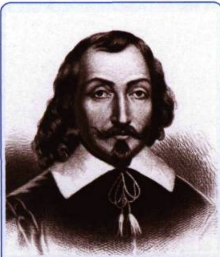
Le plus connu des « portraits » de Samuel de Champlain, fondateur de Québec, a été fabriqué à partir de celui de Michel Particelli d'Émery, surintendant des Finances sous Louis XIII.

Champlain a effectué 23 traversées de l'Atlantique et passé plusieurs hivers en Nouvelle-France. Il a négocié avec les Amérindiens, arbitré leurs disputes, établi des alliances et mené la guerre contre les Iroquois, étant même gravement blessé au cours de la seconde bataille. Après avoir exploré plus de 2400 kilomètres le long du Saint-Laurent et quelque 2000 kilomètres de la côte atlantique, il a poursuivi ses explorations jusqu'au lac Huron et