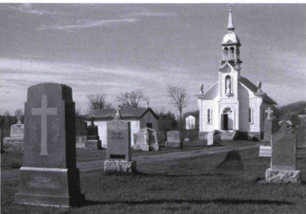
Le cimetière, un grand lieu de mémoire.

Parmi les raisons invoquées par M. de Bellefeuille – tout comme le député Champagne, ce de Bellefeuille était de Saint-Eustache et appartenait lui aussi à l'aristocratie locale – citons la mauvaise situation géographique et l'éloignement de Sainte-Scholastique, la rareté des moyens de communications, l'état de vétusté des édifices, le dynamisme de la ville de Saint-Jérôme et la nouvelle répartition de la population sur le territoire. En conclusion ce regroupement d'avocats, représentés par de Bellefeuille, suppliait le gouvernement «de présenter aux Chambres, à leur prochaine session, la législation qui pourrait être nécessaire pour fixer dans la ville de Saint-Jérôme le chef-lieu du district de Terrebonne».