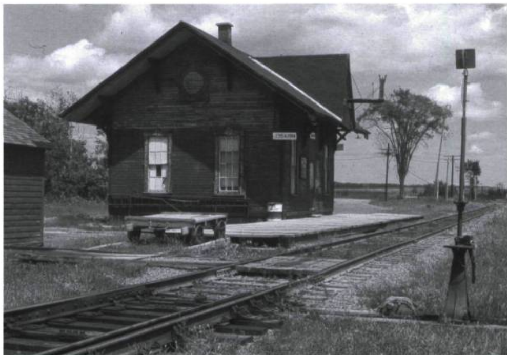
Il y avait quand même une gare bien modeste.

Aujourd'hui, Sainte-Scholastique a changé de visage. Mais le village n'a pas changé d'âme. Les événements liés à la grande expropriation des terres de Mirabel