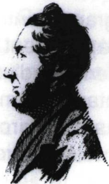
Théophile de Coigne

Les troubles de 1837 nous donnent un exemple de cette implication totale, alors que dix-huit notaires figurent parmi les chefs révolutionnaires des rébellions de 1837-1838 et quatre d'entre eux furent conduits à l'échafaud à la prison du Pied-du-Courant: François-Marie Chevalier de