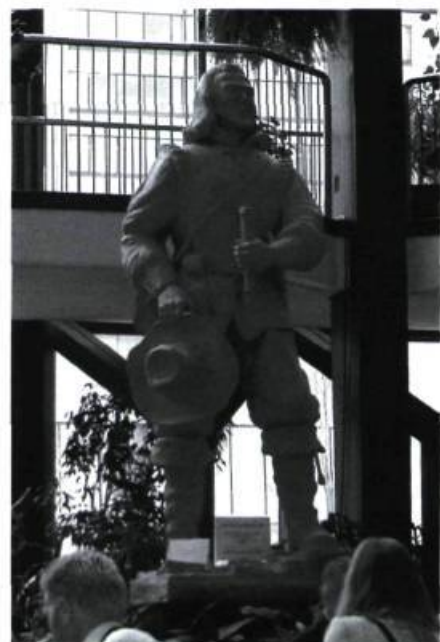
Une statue de Champlain commémore aujourd'hui, à la Maison des Citoyens de Hull, la présence de l'explorateur dans la région.

et trois de large où il y a quelques îles (Lac des Deux-Montagnes): Le pays d'alentour est fort uni, hormis en quelques endroits, où il y a des côteaux couverts de pins. Nous passâmes un saut qui est appelé de ceux du pays Quenouchouan qui est rempli de pierres et de rochers, où l'eau y court de grand vitesse; il nous fallut mettre à l'eau et traîner nos canots bord à bord de terre avec une corde; à demi lieue de là nous en passâmes un autre petit à force d'avirons, ce qui ne se fait pas sans suer, et y a une grande dextérité à passer ces Sauts pour éviter les bouillons et brisants qui les traversent; ce que les Sauvages font d'une telle