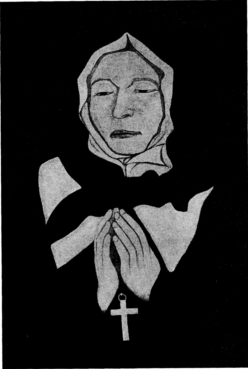
Le vrai portrait de la bienheureuse Marguerite Bourgeoys fondatrice de la Congrégation de Notre-Dame de Montréal 1620 - 1700