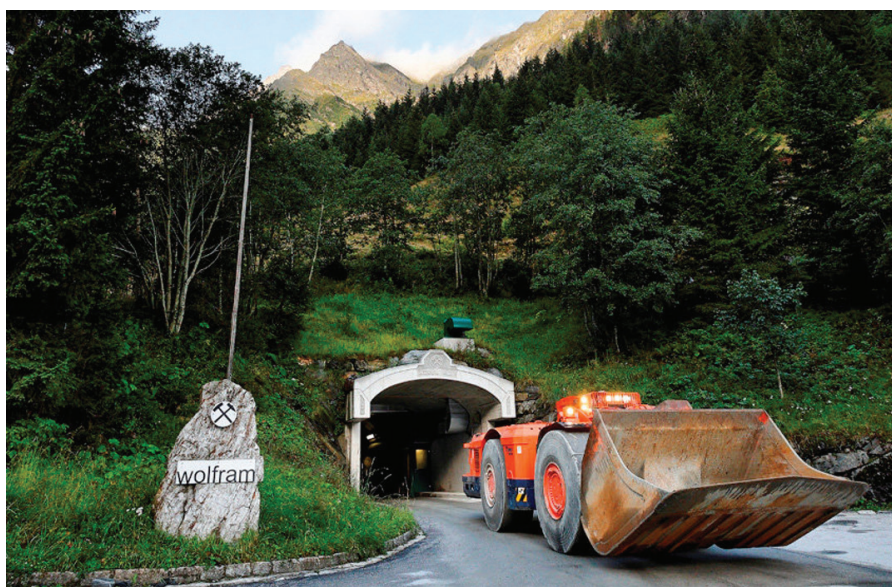
Image 1. Entrée principale de la mine souterraine de tungstène de Mittersill

trouvant dans un espace naturel protégé (Gaul, 2014). La mine de Mittersill symbolise ainsi la nouvelle image que souhaite se donner l'industrie minière : celle d'une industrie verte et responsable qui s'intègre dans le paysage et n'a que peu d'impacts. En ce sens, elle constitue un « haut-lieu » pour les acteurs du renouveau minier : elle « matérialise et rend visible, donc sensible, des valeurs abstraites qu'il est convenu de lui associer » (Debarbieux, 1993, p.6).