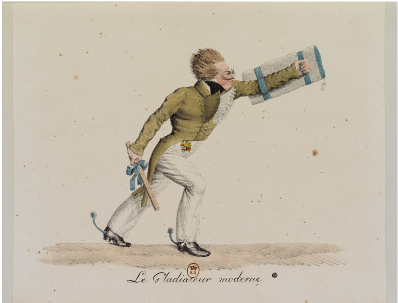
FIG. 6. Le Gladiateur moderne , chez Delpech, lithographie aquarellée, 1817. Paris, BnF. Est.

présentent comme autant de variations plus affectées qu'athlétiques du Gladiateur moderne . Le costume du Calicot altère le canon antique et remodèle la silhouette en accentuant la disproportion des parties du corps (la taille fine et la poitrine large). Contrairement à la nudité, porteuse d'idéaux universels, le corps vêtu devient signe ostentatoire d'une culture des apparences, d'autant que le costume du Calicot constitue une mascarade par laquelle il tente d'usurper une identité, un statut, une vertu. Dans ces parodies de la bravoure martiale, où le Calicot troque la lance et le glaive des Anciens contre la perche à linge et l'aune à mesurer, l'abondance de tissus dont on affuble ce guerrier d'occasion — pantalon bouffant, jabot exubérant, épaulettes en pelotes d'épingles, ballots de tissu en guise de casque, de cuirasse ou de bouclier — convoque l'image d'une virilité ridicule et inadéquate pour les activités militaires. Parallèlement, d'autres caricatures insistent plutôt sur la capitulation du Calicot, qui, à l'instar de Samson rasé, voit ses moustaches coupées, et par conséquent, ses prétentions viriles invalidées.