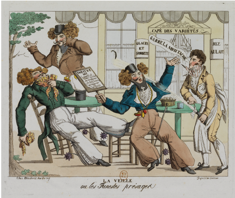
FIG. 4. La veille ou les Funestes présages , chez Martinet, gravure en taille-douce aquarellée, 1817. Paris, BnF. Est.

et à la vigueur physique 34 —, les Calicots juvéniles sont contraints de recourir aux moustaches postiches, attribut de la jeunesse masculine au seuil de l'âge adulte 35 .