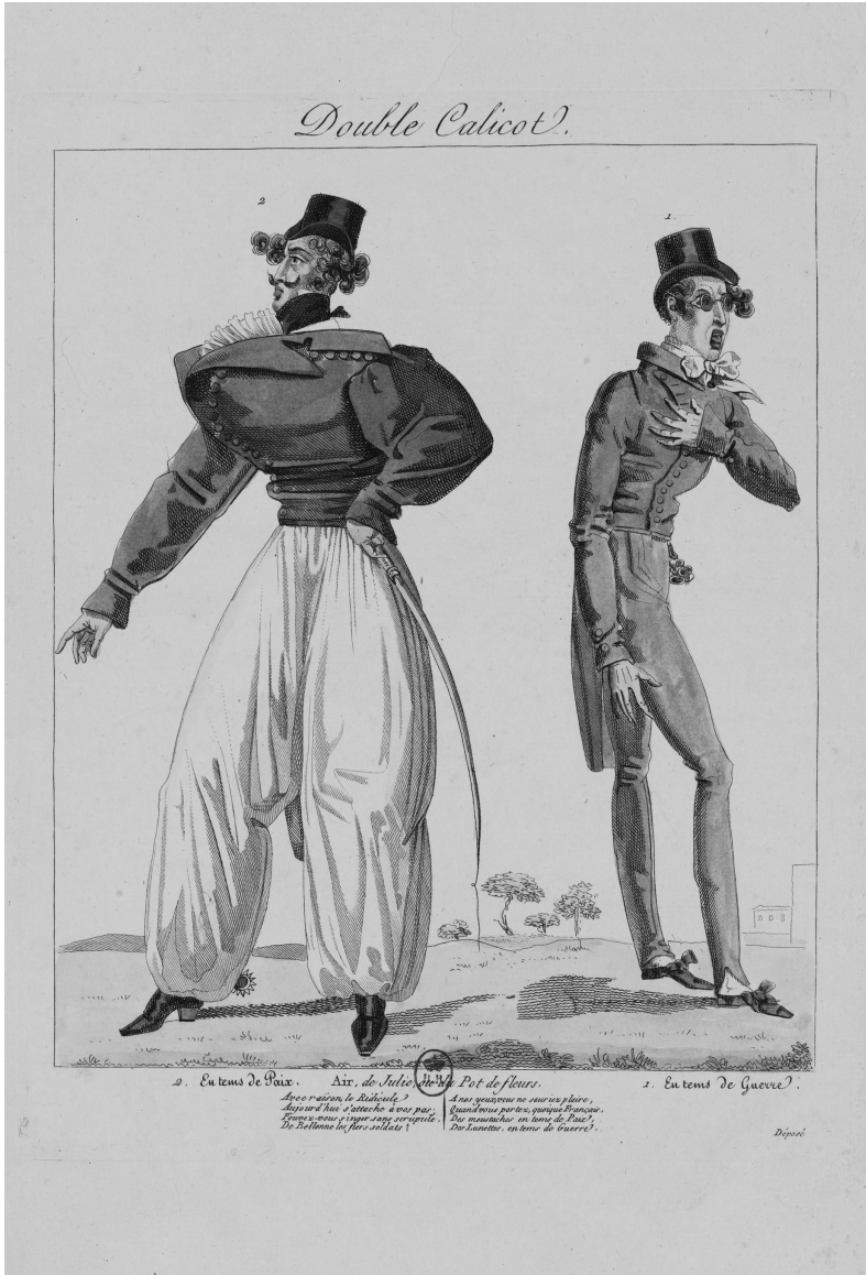
FIG. 1. Double Calicot , chez Gauthier, gravure en taille-douce aquarellée, 1817. Paris, BnF. Est.