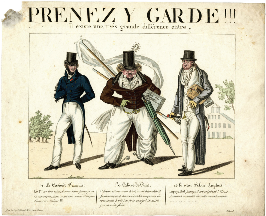
FIG. 3. Prenez y garde , chez Gauthier, lithographie aquarellée, 1817. Londres, British Museum.

L'estampe Prenez y garde (fig. 3), annoncée le 20 septembre 1817, prévient le lectorat contre trois types de capitalistes prospères sous la Restauration : le marchand de cachemire français, le marchand de nouveautés parisien et l'importateur anglais de produits étrangers 16 . Mais cette estampe dresse aussi une typologie sociale qui résume la condition de chacun par la nature d'une étoffe qui le caractérise et met en valeur l'aura militaire dans la formation des identités masculines. Ainsi, à droite, le bourgeois anglais qui déferle sur la France est qualifié de Pékin, nom donné à une étoffe de soie, mais qui désigne aussi la tenue civile bourgeoise, par opposition à la tenue militaire. À gauche, le Casimir français, du nom donné au tricot de laine fin, léger et cher, offre l'image élégante du militaire : il porte la moustache, la chevelure