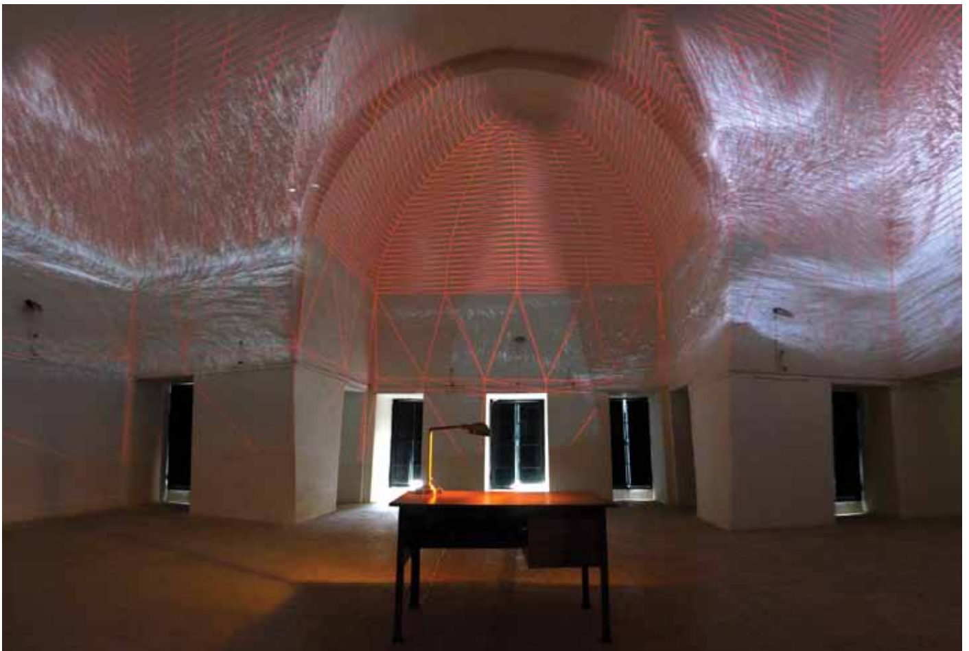
La maison sensible. Expo- sition au Palais Abdellia / E-Fest Digital Arts Festival, Tunis, 2015.