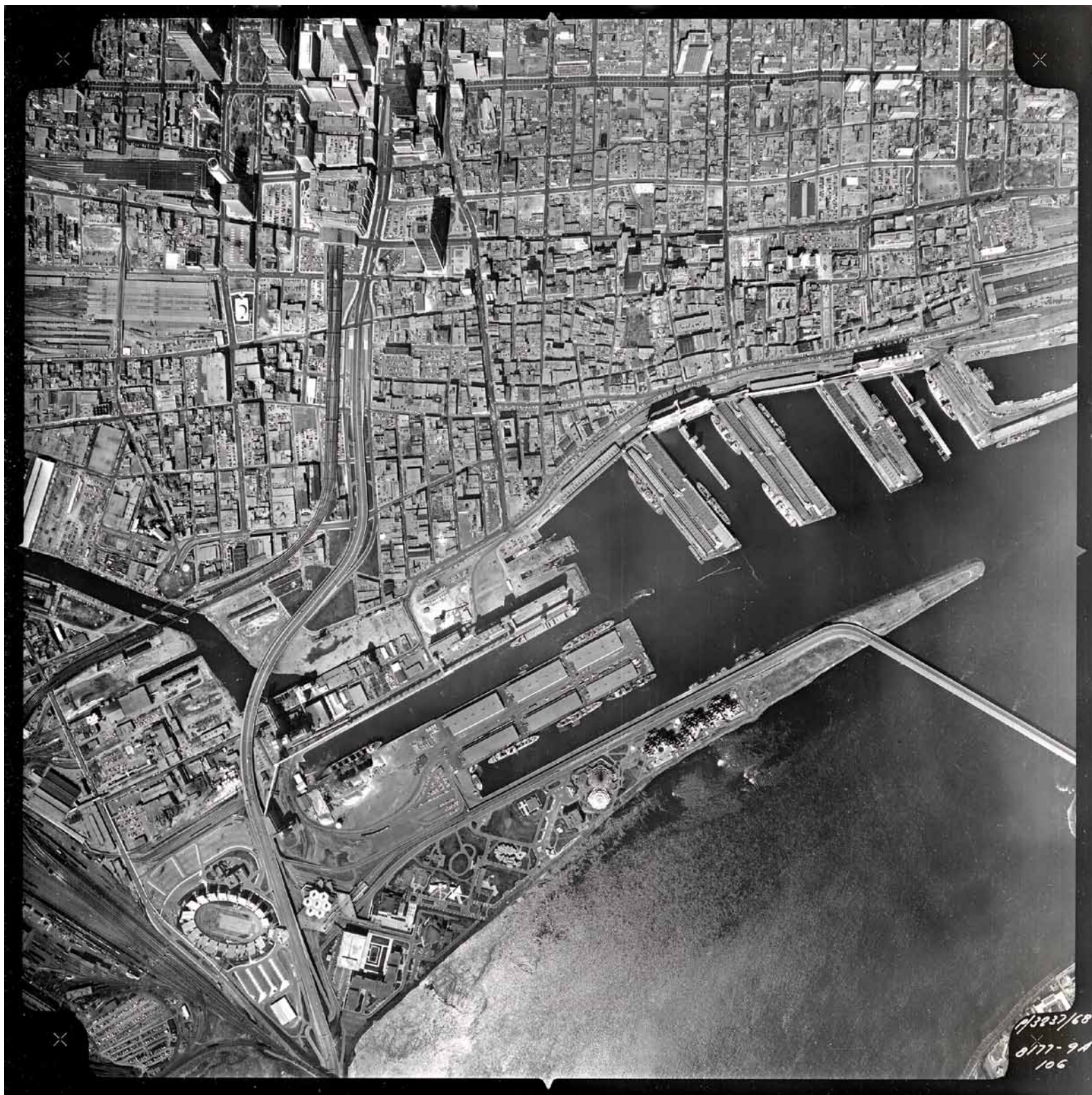
Mishka Henner, exposition au Musée McCord, Tramé en altitude : la Photogrammétrie de Montréal.