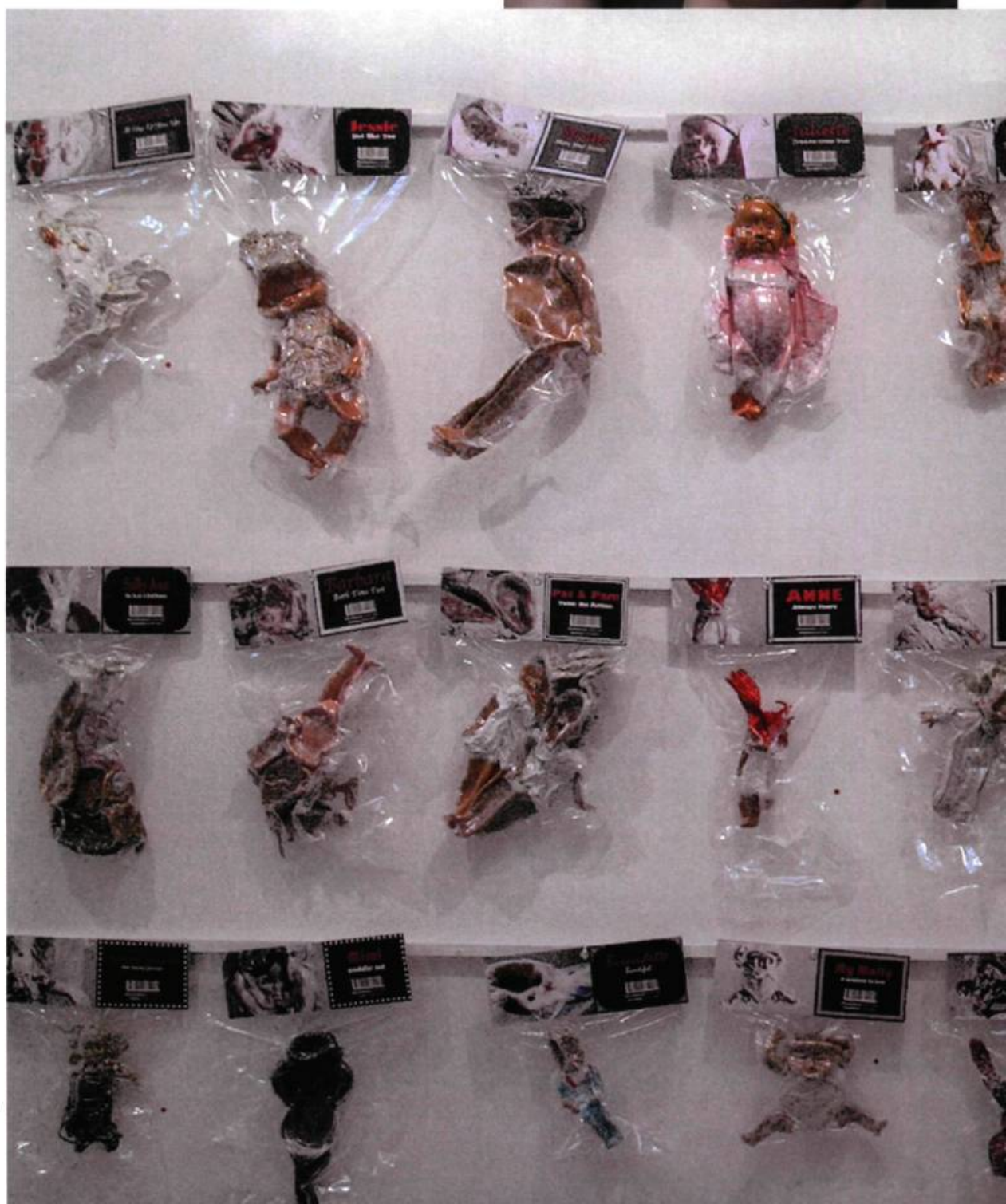
Julianne Rose, Armed Response #14, 26, 27, 2006. Tirage lambda contrecollé sur aluminium, sous Diasec mat. Édition de 8 + 1 e.a.