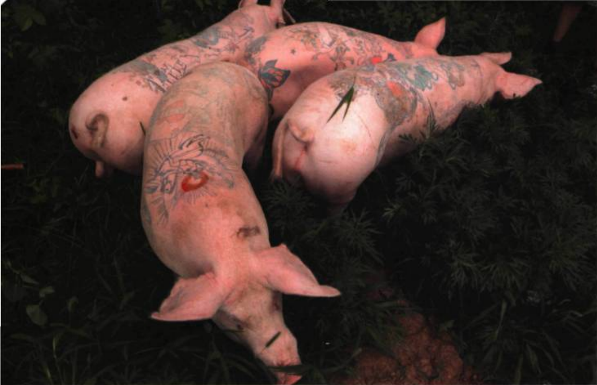
Wim Delvoyed, Pigskins , 2002-2003.

l'exposition. Il faut dire qu'à l'origine de ce projet, je ne pensais pas faire d'exposition en Chine, l'idée était de faire une production puis de la faire venir ici. Je ne pensais pas me mêler à la société chinoise. Mais devant l'empressement de la Presse, j'ai décidé de faire visiter la ferme qui prenait l'allure d'un concept vivant, d'une œuvre.