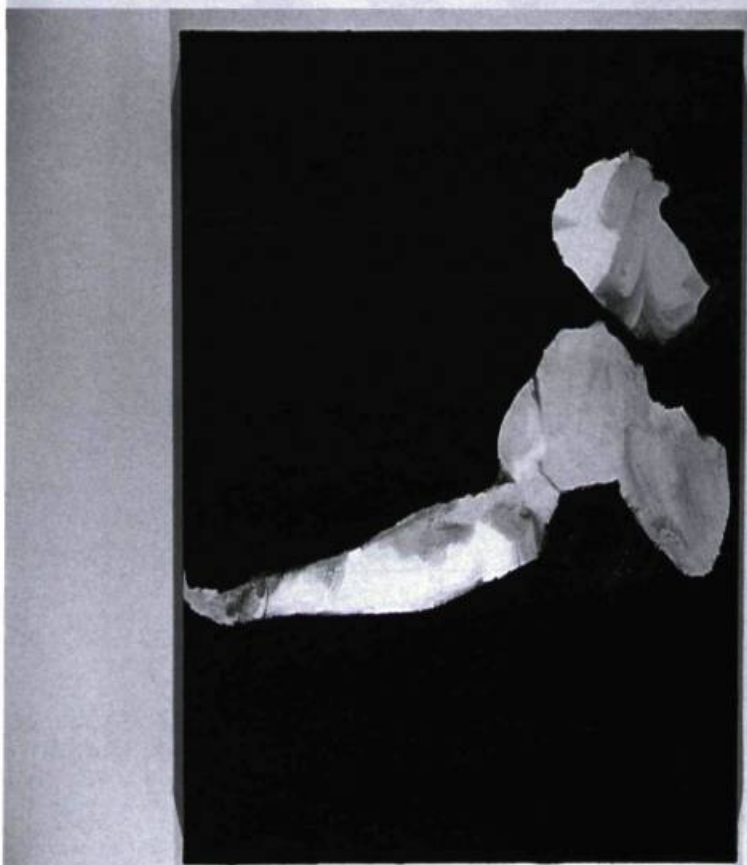
Louise Masson, Scène d'amour XII , 2002. 71 x 71 cm. Galerie Trois Points, Montréal.