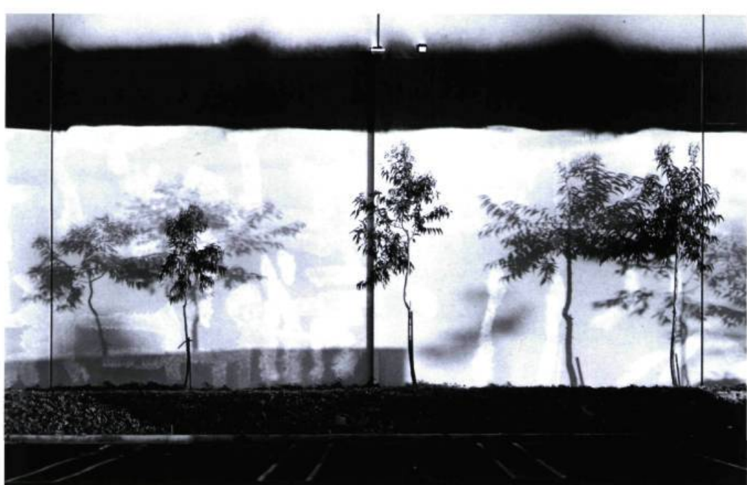
Lewis Baltz, Mur ouest, Semiaca, 333 McCormick, Costa Mesa. Élément n° 39 tiré de The New Industrial Parks near Irvine, California , 1974. Épreuve argentique à la gélatine; 15, 4 x 22, 9 cm. Collection Centre Canadien d'Architecture, Montréal. © Lewis Baltz

Baltz inclut ces allusions à la nature afin de souligner le contraste avec le monde de l'industrie, mais quand on observe de plus près ces plantations génériques, on se dit qu'il veut peut-être souligner l'ironie de ce « parc » dont les arbres sont aussi malingres que le nom.