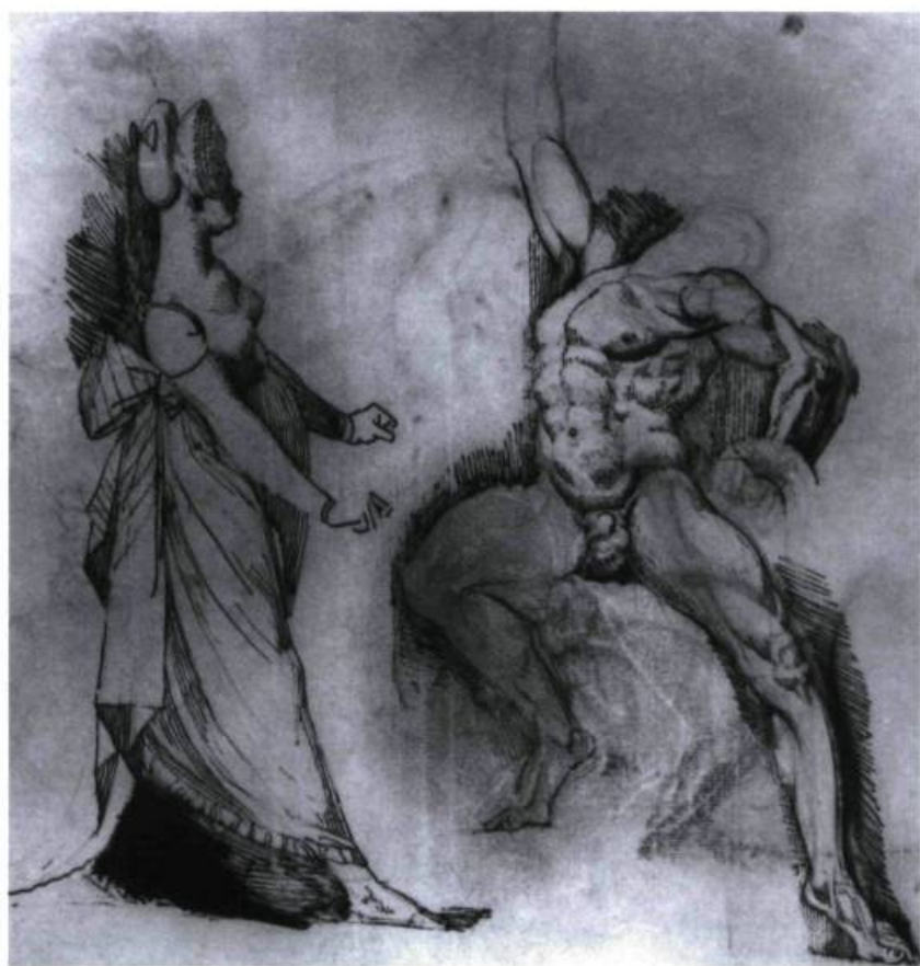
J. H. Füssli, Femme devant le Laccoon , 1801-05.

D'autres médiums qui pourtant pourraient eux aussi permettre une plus grande diffusion des images semblent avoir eux aussi été limités dans leurs usages. Dans le milieu des arts, les tirages photos se font de plus en plus en quantités limitées. Ce fut une révolution récemment lorsqu'une compagnie a réussi à convaincre des photographes de vendre en plus grand nombre (et moins cher donc) certaines de leurs images. Même la vidéo et le cinéma semblent être extrêmement contrôlés de nos jours. Matthew Barney, par exemple, présente au compte-goutte son cycle des Cremaster dans certaines villes et pour une période très limitée.