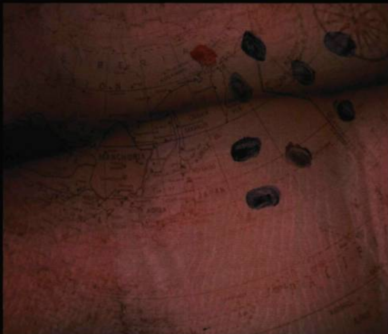
Louise Boisvert, Empreintes , 2000. Infographie.