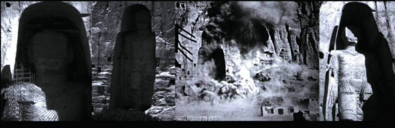
Destruction des Bouddhas géants de Bamiyan, 2001.

Pour les iconoclastes de Byzance, il était inadmissible de représenter Dieu sous un visage humain. Pour les iconoclastes moderne il y a un refus ou une incapacité de se représenter son propre corps, d'autant que le corps est porteur d'images. Dans ce rapport entre incarnation et mise-en-image, confier son corps à