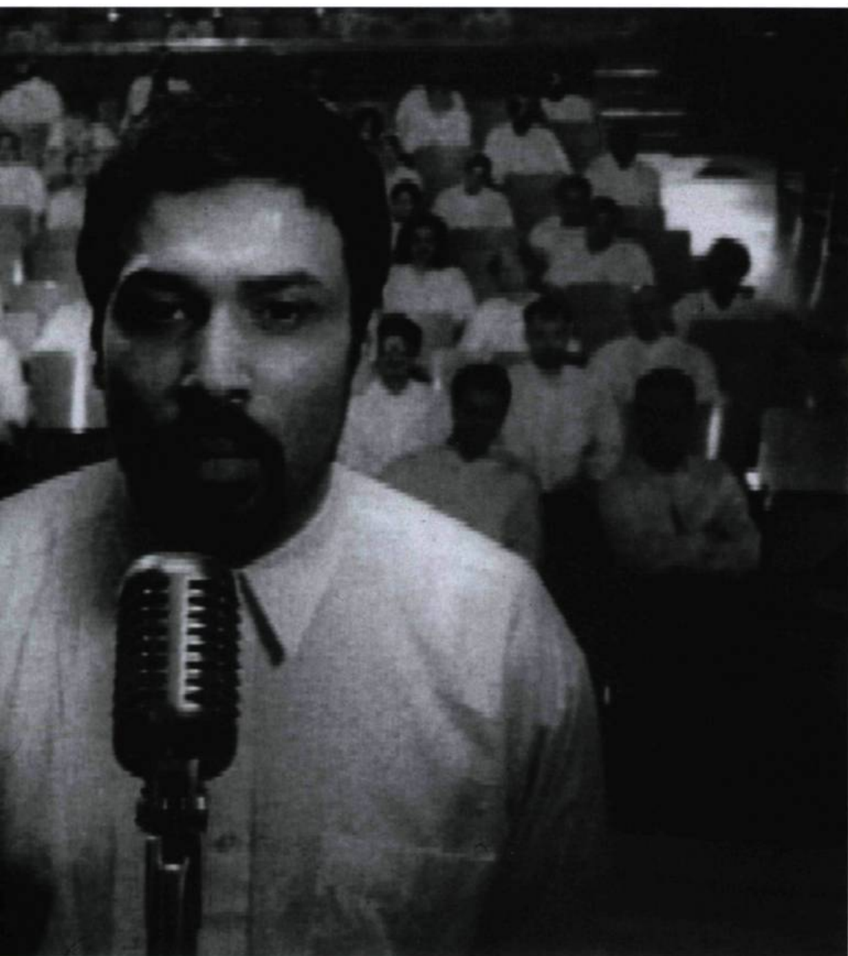
Shirin Neshat, Turbulent , 1998. © Shirin Neshat. Gracieuseté Shirin Neshat.