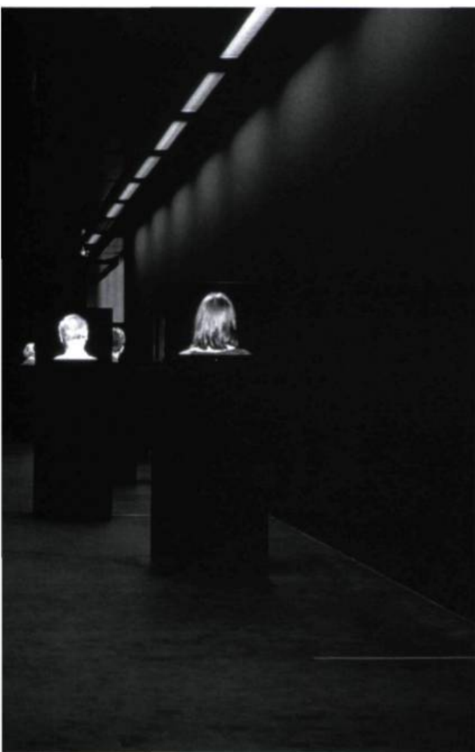
Ute Friederike Jürß, A Capella Portrait , 1996. © Ute Friederike Jürß. Photo: Bernhard Schmitt, Karlsruhe. Gracieuseté Ute Friederike Jürß.