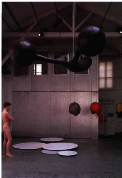
Expand 1, Atelier Van Lieshout, The Pitiful One, 1996, + Sensory Deprivation Helmets, 1999. Galerie Roger Pailhas, Marseille. Xavier Veilhan, Les Machines Tourantes, 1995, Galerie Jennifer Flay.

Arrêtons là la forme et voyons maintenant le fond : les artistes et leur travail. Je n'ai évidemment pas l'espace pour parler de tous. Je choisis donc arbitrairement quatre d'entre eux. Chacun, à sa manière, représente une attitude singulière. Que se soit Heger & Dejanov, qui demandent à