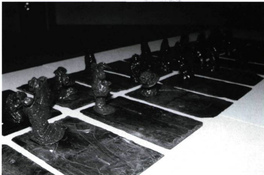
L'exode - installation. Élèves de 1 re et 2 e secondaire, École Sacré-Cœur, Richmond, 1997. Figurines d'argile et plaques d'ardoise. Enseignante: Francine Péloquin. Projet réalisé à la suite de l'étude de l'œuvre Migrations , de René Deroin.

tainement très difficile de prétendre que le futur enseignant aura reçu tous les outils pour se familiariser avec les multiples aspects de l'art contemporain, dont l'apport des arts médiatiques, afin d'intéresser ses futurs élèves. Même si certaines universités ont partiellement contourné ce problème en instituant les arts médiatiques ou l'informatique comme disciplines complémentaires, le défi est de taille et les autorités universitaires sont déchirées entre les exigences de la formation artistique et les diktats ministériels qui multiplient les exigences de formation psychopédagogique.