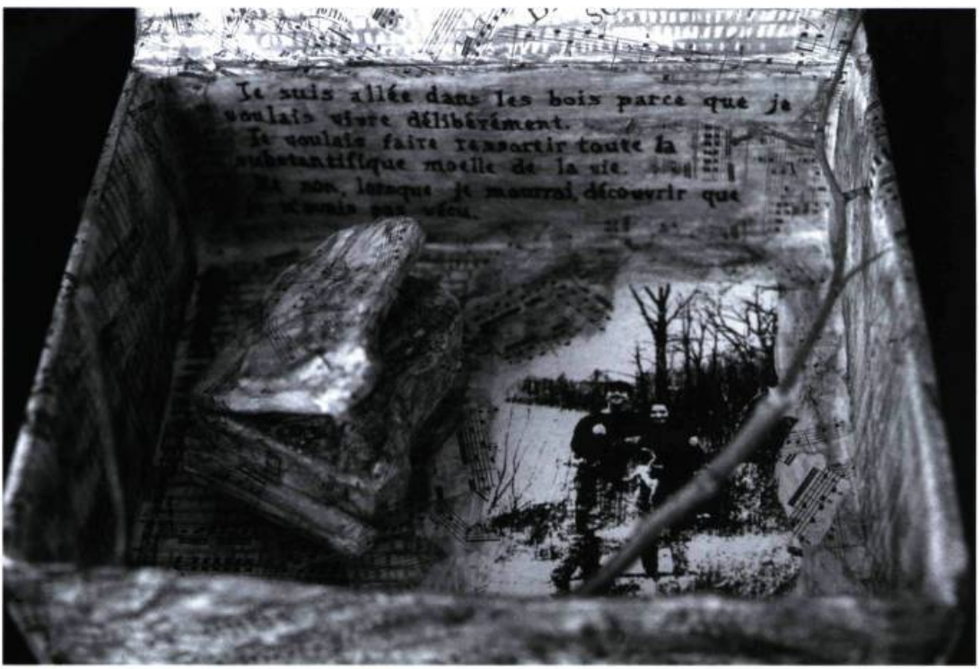
Fragments de vie ou un moment dans la vie de... Éléves de 4 e secondaire, École Félix-Leclerc, Repentigny, 1994. Techniques mixtes. Recherche de maîtrise: Mona Trudel. Projet réalisé à la suite de la rencontre avec le photographe Michel Campeau.

saxons ont tôt fait d'intégrer dans ce mouvement les théories critiques du postmodernisme, en valorisant une culture anthropologique qui contrecarre l'élitisme de la culture humaniste.