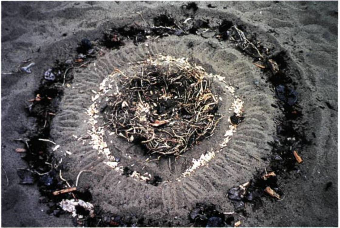
Construire un paysage. Éléves de 4 e année du primaire, école Notre-Dame-de-la-Défense, Montréal, 1995. Matériaux trouvés sur les lieux. Enseignante: Laurence Sylvestre. Projet réalisé à la suite de l'étude des travaux d'artistes contemporains du Land Art.

D ans les milieux artistiques, il est souvent question de la réception de l'art contemporain par le public, et des tensions et crises qui en découlent. Nous souhaitons rendre compte des rapports que le milieu scolaire entretient avec l'art contemporain, dans le cadre des cours d'arts plastiques dispensés dans les écoles primaires et secondaires. Pour cerner les enjeux que soulève ce questionnement, nous tenterons de répondre à trois questions : où se situe la place de l'art contemporain dans le contexte éducatif international d'où émergent les grandes tendances en enseignement des arts ? Les politiques institutionnelles québécoises favorisent-elles le rapport des élèves avec l'art actuel ? Quels sont les modèles pédagogiques qui intègrent l'art contemporain dans les classes ?