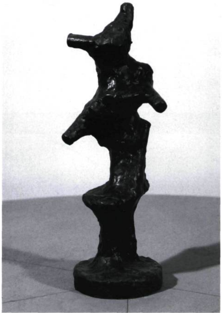
Ulysse Comtois, Sans titre , 1984. Cire; 36, 5 x 12 x 13 cm.

Le reflet du travailleur assidu, à l'image de « l'artisan » auquel on se plaisait à l'identifier, trouvait également écho dans son dense atelier de sculpture. Malgré un ralentissement de la production sculpturale de l'artiste au cours des quinze dernières années, celui-ci ne s'est jamais départi de l'équipement lourd des débuts, faisant contre-poids aux étagères truffées de sculptures de moyens et petits formats qui tapissent les murs. La passion du travail hantait encore les lieux de cette sorte d'atelier-laboratoire au sein duquel Comtois s'est engagé à construire une œuvre insolite qui a su coupler la tradition du travail