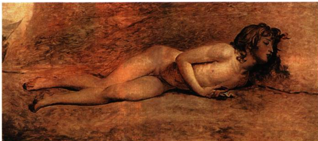
Jacques Louis David, La Mort du jeune Bara , vers 1794. Huile sur toile; 155 x 118 cm. Avignon, musée Calvet.

L'histoire de l'art de l'historien néo-classique Winckelmann est remplie de ces corps qui ne respectent plus la spécificité fonctionnelle de leurs organes génitaux. Il faudrait réécouter Winckelmann, qui écrivait que « l'unique moyen pour nous de devenir grands et, si c'est possible, inimitables, c'est d'imiter les anciens » [c'est nous qui soulignons] 5 . Ce devenir résonne alors autrement. Il ne s'agit plus de faire de l'Occident moderne une culture stable et forte centrée sur une identité masculine puissante qui s'inspire du militarisme romain, ayant donné naissance à des héros forts comme Napoléon. Il faut lire cette phrase à l'envers. Pour pouvoir disparaître , il faut faire comme les grecs. Qu'est-ce à dire ?