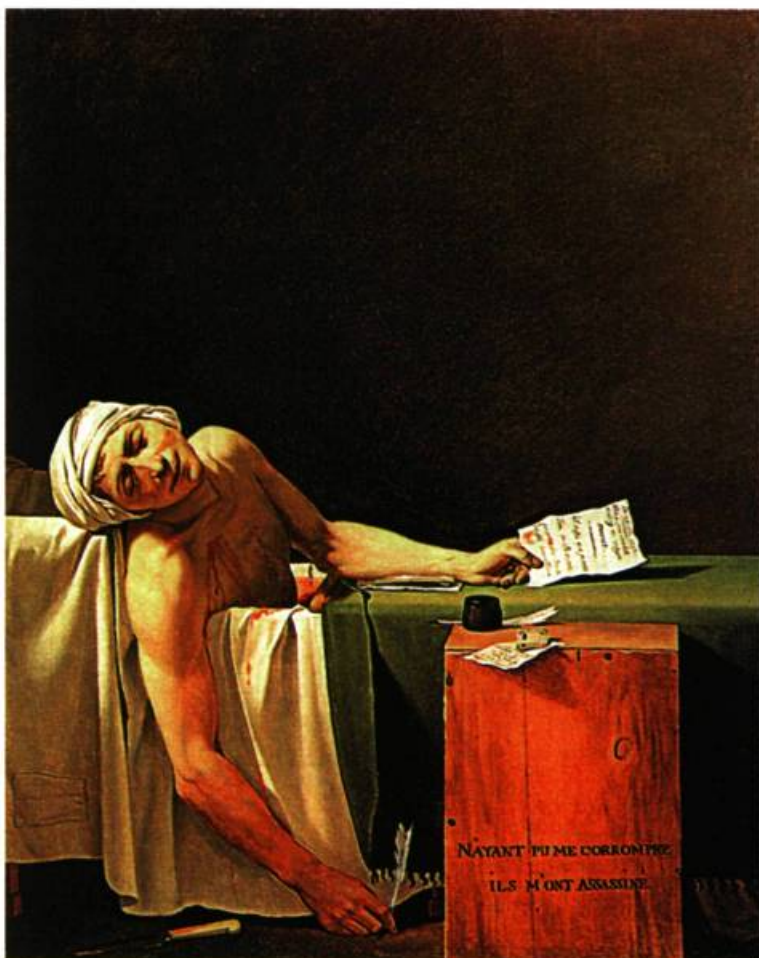
Louis David, Marat assassiné , 1793. Huile sur toile; 162 x 130 cm. Réplique du tableau donné par David à la Convention, 1793. Musées Royaux des Beaux-Arts, Bruxelles; legs du baron Jeanin.

lire une définition beaucoup plus négative des usages nouveaux des organes et de la sexualité :