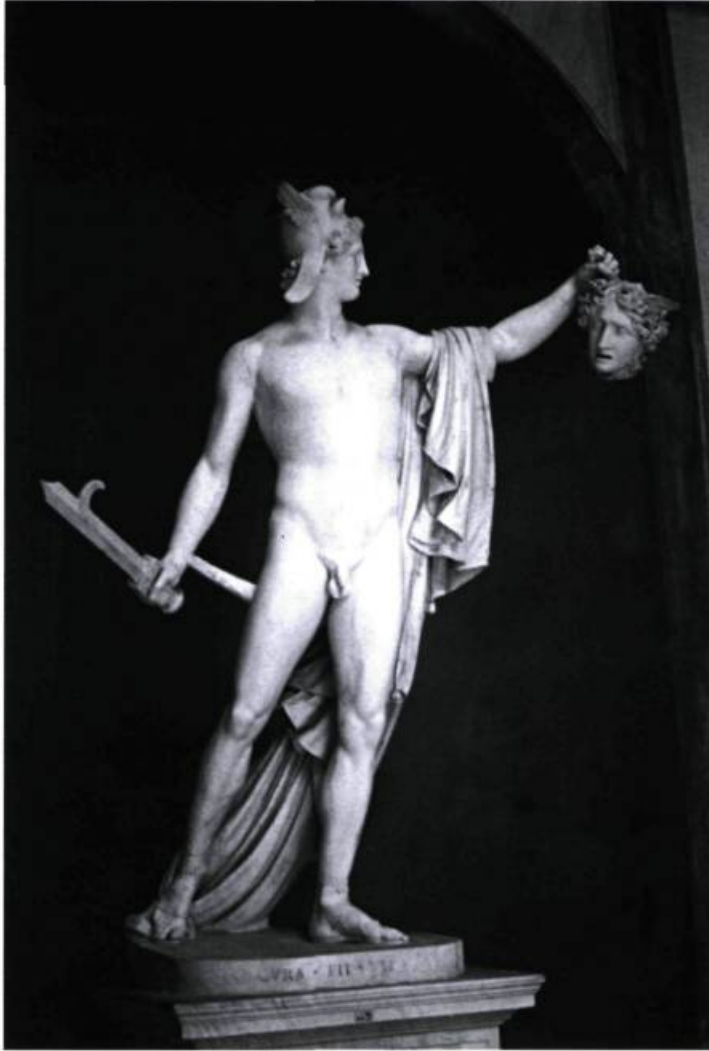
Antonio Canova, Persée , 1801.

« ... l'académisme antique, reparu, sembla proclamer la valeur artistique du désir ... »