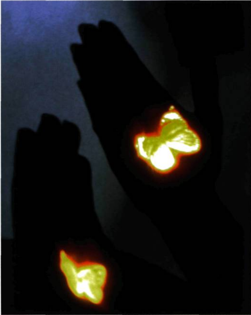
Bertrand Gadenne, Les Papillons , 1988. Photographie. Détail de l'installation.

Photographie et Immatérialité, Mois de la Photo, Marché Bonsecours, Montréal. Du 5 septembre au 15 octobre 1997