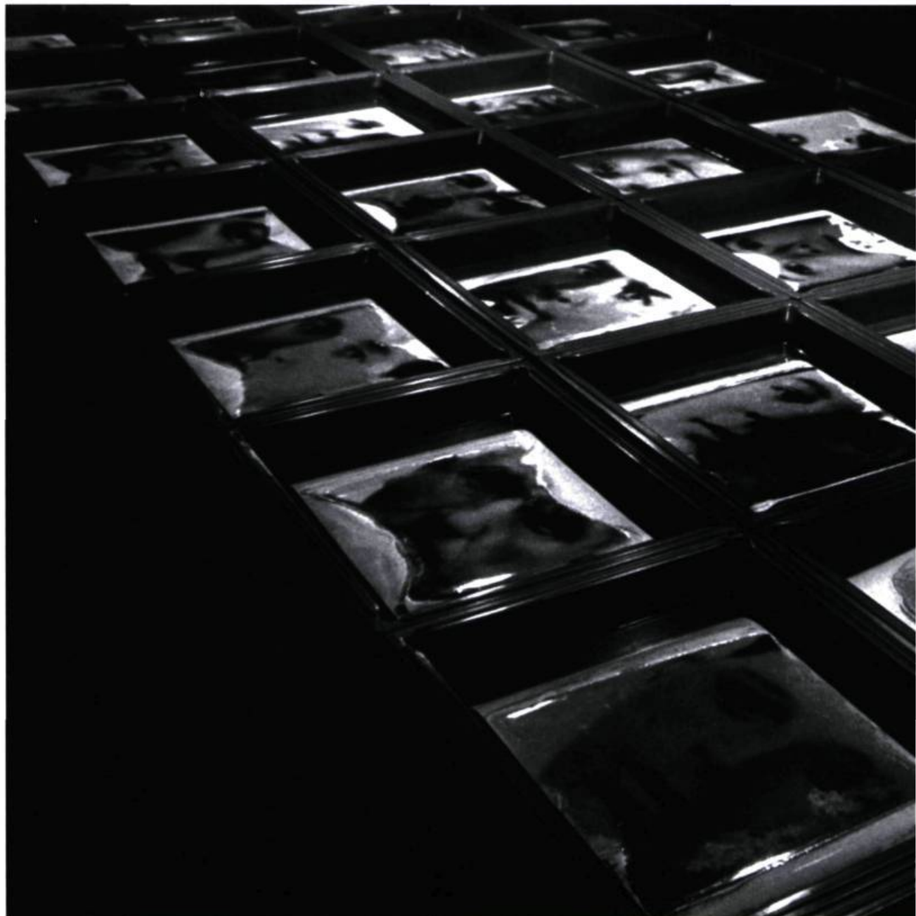
Alain Fleisher, Le regard des morts , 1995. Détail de l'installation.

procédé photoélectrique rappelle l'importance de ne pas cantonner l'indicialité à la trace d'une réalité référentielle. Tout comme l'échographie qui repose sur la numérisation d'ultrasons, la relation de contiguïté entre le signe et son référent peut parfois prendre la forme d'un encodage.