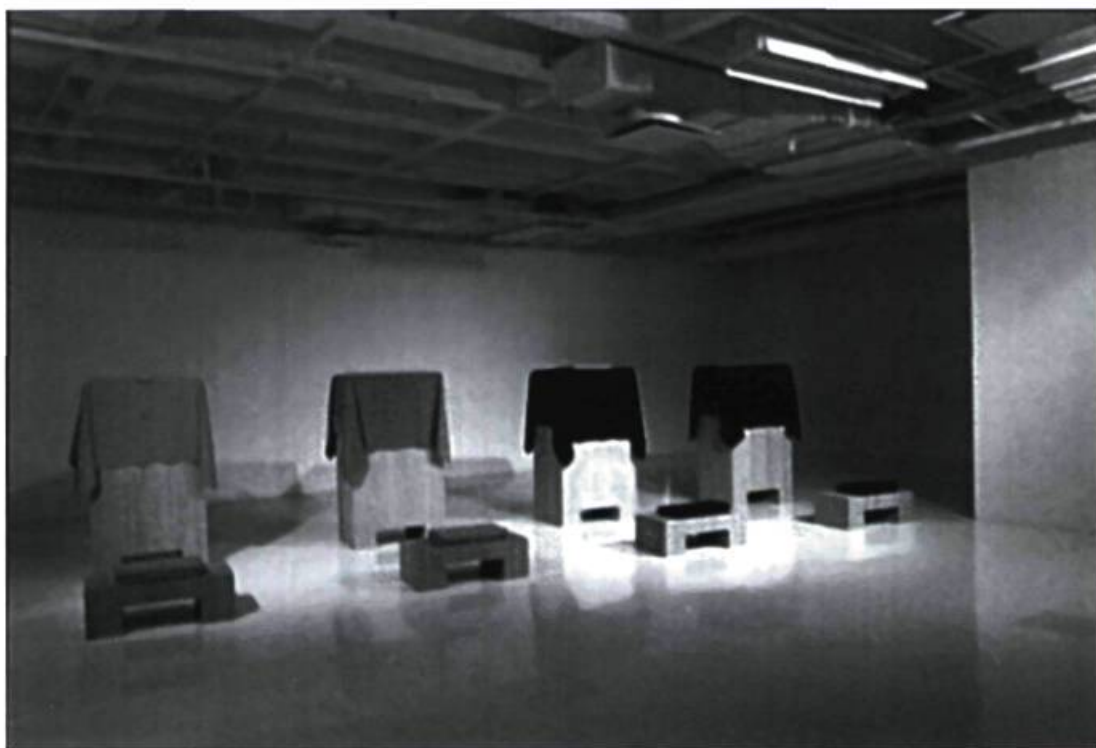
Eva Brandl, Faust ou la tentation du possible , 1996. Cachemir, bois de cerisier, feutre sur bois découpé; 610 x 183 x 122 cm. Vue partielle de l'installation.

Eva Brandl, Faust, ou la tentation du possible , Galerie Christiane Chassay, Montréal. Du 6 septembre au 5 octobre 1996